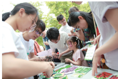
▲ 地区职工子女制作种子球