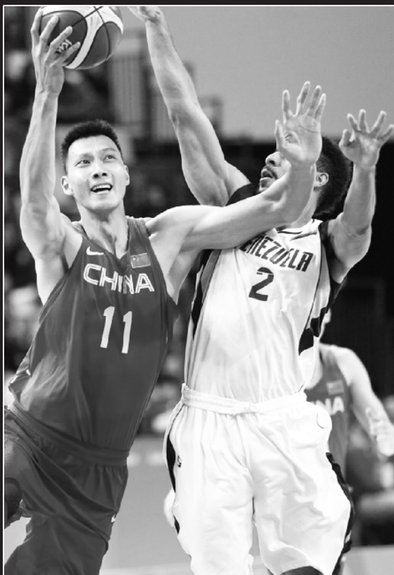
委内瑞拉堪称中国队苦主