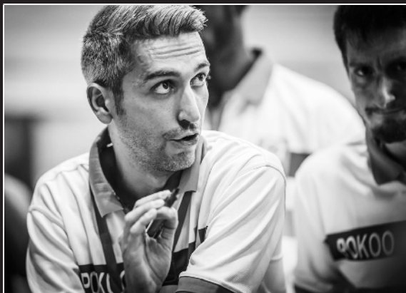
科特迪瓦主帅保罗·波维亚

2017年在欧锦赛仅获一胜的波兰队正处在尴尬的历史低点,但这支拥有着身材强壮、配合细腻等典型欧洲球队特征的没落豪门在世锦赛历史上,虽然中国队和波兰队从未交过手,但双方曾多次在大赛前进行热身赛,互有胜负,且分差不大。因此,单从实力上分析,波兰队丝毫不逊于中国队。换句话说,波兰队应该是与中国队竞争小组出线权的劲敌。