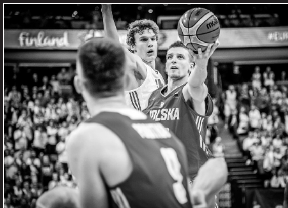
波兰队是中国队竞争小组出线权的劲敌