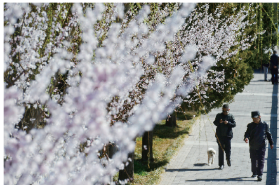
▲前三门大街边的山桃花、迎春花竞相开放。