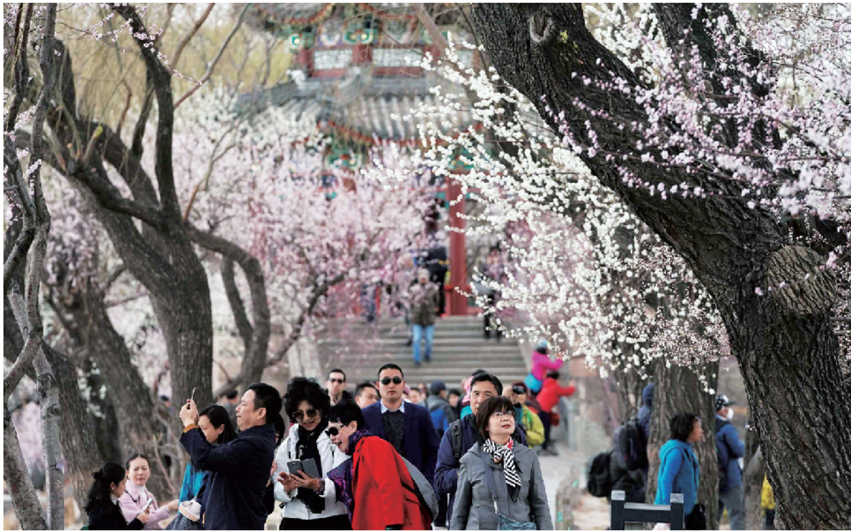
颐和园桃花盛开，赏花人川流不息。