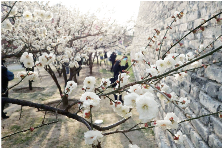
明城墙遗址公园的朵朵腊梅，在古老城墙的映衬下格外娇艳。