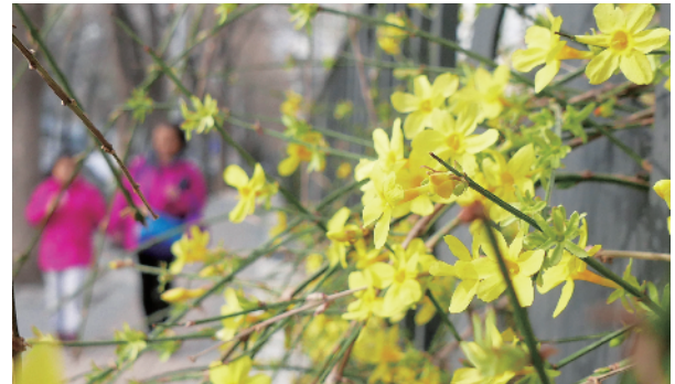
居民小区里，迎春花盛开。