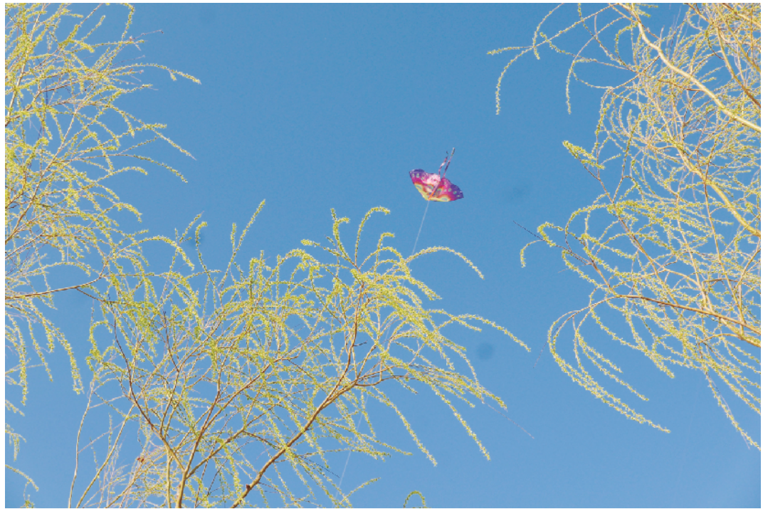
通州大运河两岸绿柳成行，人们放飞风筝。