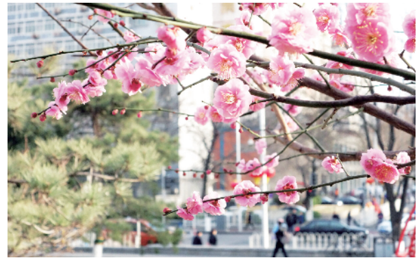
桃花将京城装点成一幅画卷，走在街头仿佛人在画中游。