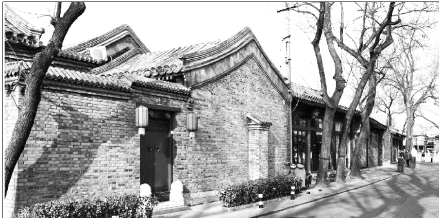
干净整洁的什刹海体现了老北京味儿。