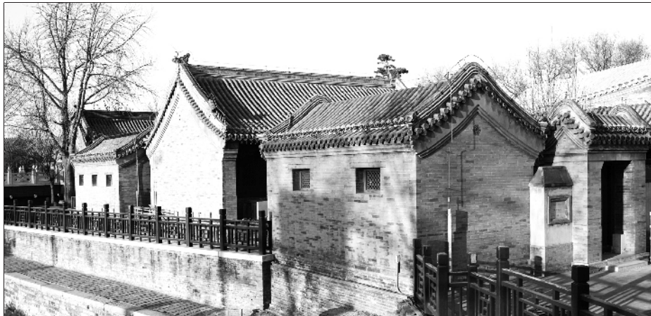
东不压桥改建恢复了原貌。