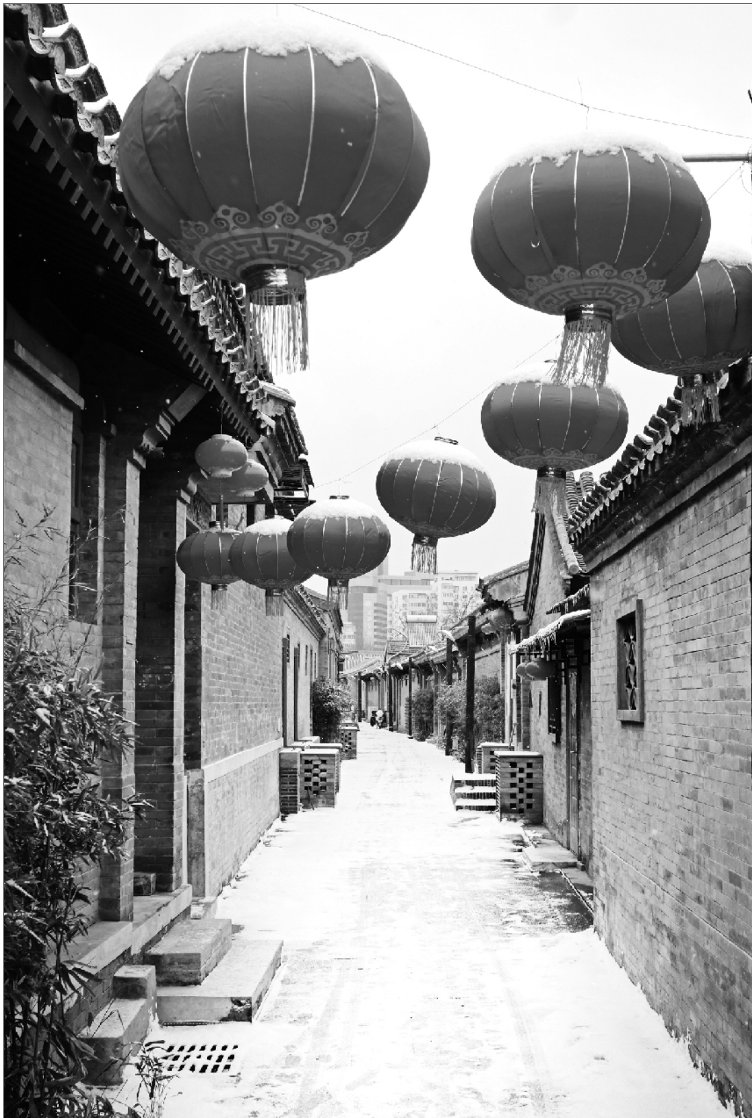
雪后的草场三条胡同。