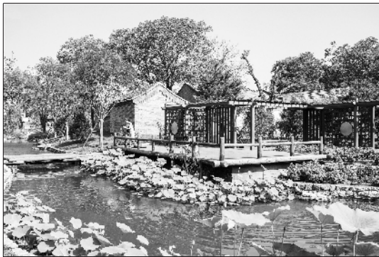
恢复重建的三里河夏季荷花飘香景色迷人。