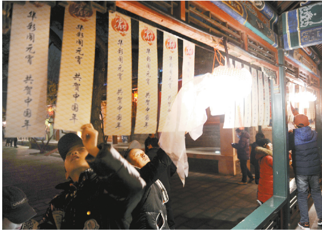
大观园游园灯会上举办的猜灯谜和杂技表演仿佛将人们带到了“梦回红楼”的时空隧道。