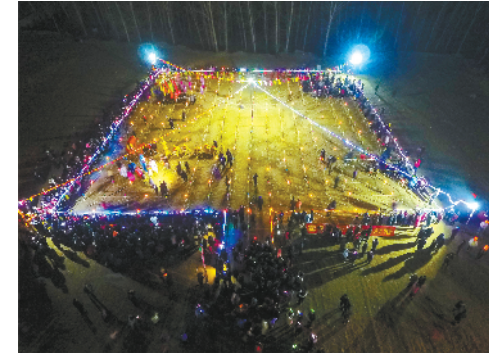
密云太师屯镇的元宵灯会。