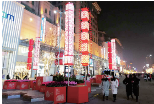
王府井大街灯光璀璨。