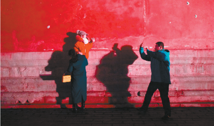
一家三口在故宫城墙下拍照，留下美好瞬间。