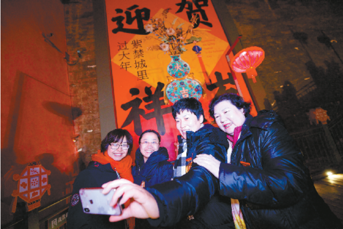
130名劳模代表及家属受邀前往故宫观灯赏景。