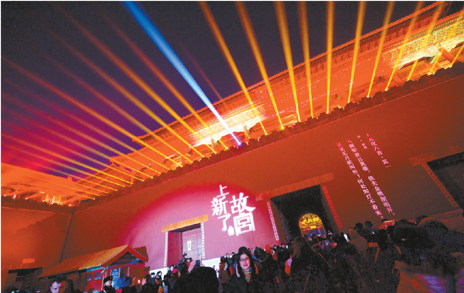
“紫禁城上元之夜”活动，是建院94年来首次晚间免费对公众开放。