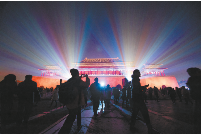
灯光下的故宫，古典与艺术结合，给人们带来强烈的视觉冲击。