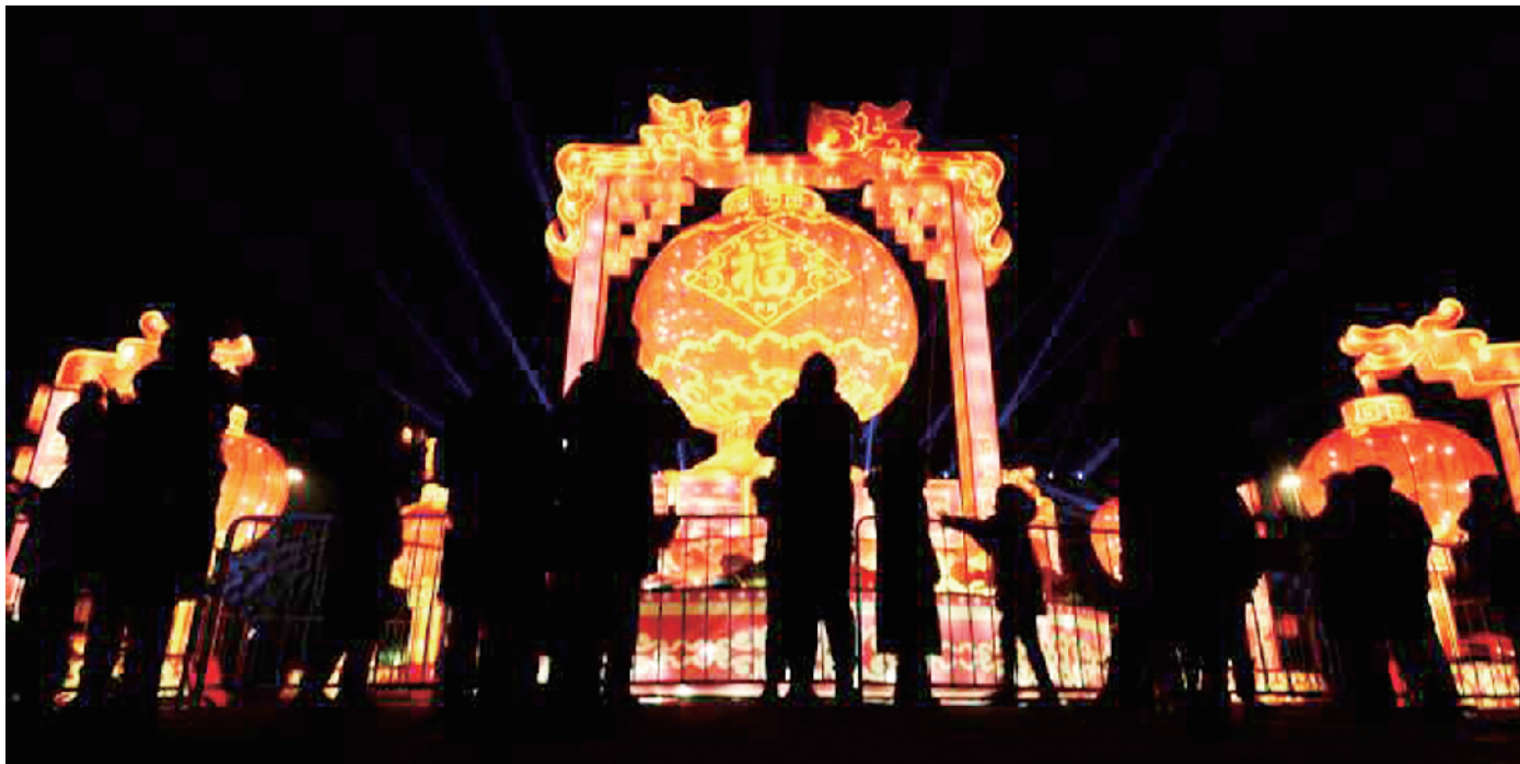
永定门公园展出18组大型民俗立体灯饰。