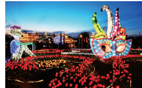
在世界公园人们观赏赏灯乐在其中。

昨天，正月十五，“福满京城 春贺神州”元宵节灯会在全市展开。19处重点灯会活动与文艺演出相结合，古老传统技艺与新时代主题相结合，传统灯会与现代灯光秀相结合，北京特色与国际元素相结合，共同为京城市民元宵节活动提供了丰富的选择。 元宵节是中国传统节日，元宵之夜有燃灯、观灯之俗。今年北京的元宵节，无论城市还是乡村，处处张灯结彩、舞龙舞狮、欢天喜地热闹非凡，赏灯会、走花车、闹元宵……一片欢乐祥和。