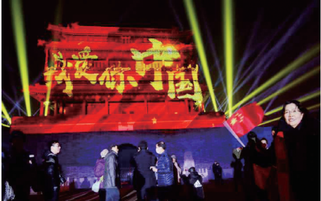
永定门公园的创意灯光秀，是传统技艺与新兴技术的结合。