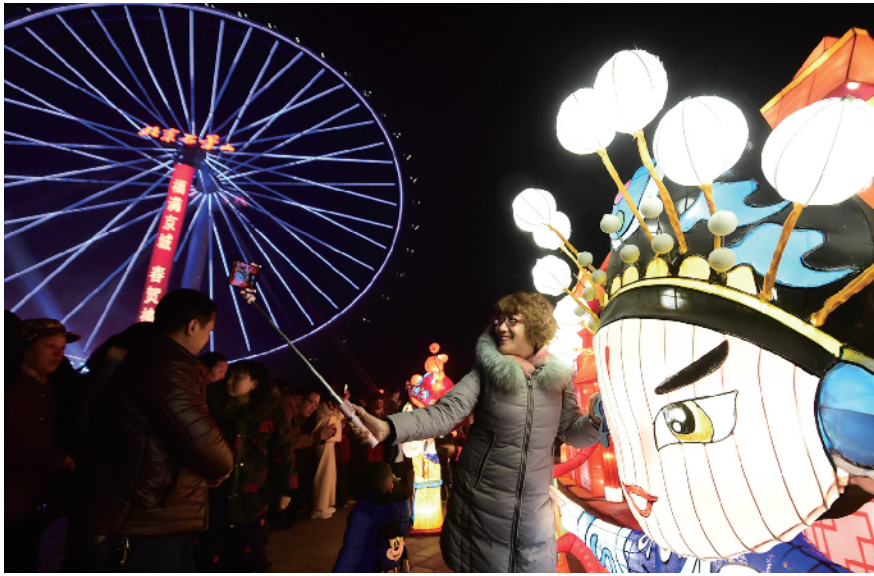
石景山游乐园元宵灯会游人如织。