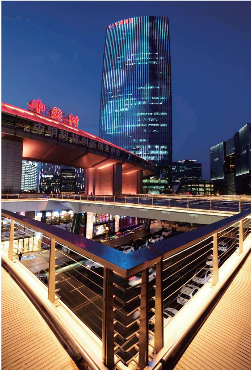
海淀中关村科技广场亮出“改革开放40年”“祝福祖国”为主题的灯光秀。