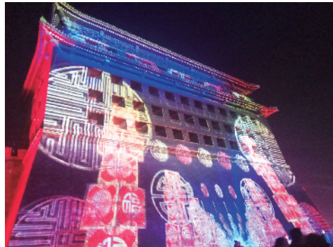
近600年的德胜门城楼首次上演灯光秀。