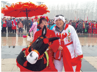
大兴榆堡镇新春文化庙会火热举办。