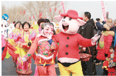
海淀苏家坨镇生肖大头娃娃憨态可掬。