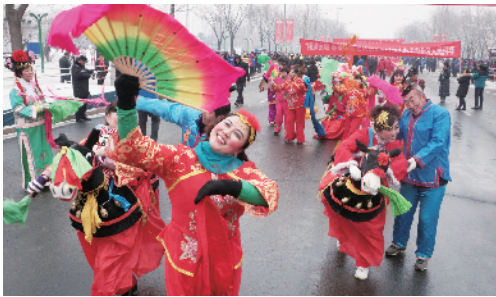
延庆区群众以秧歌、花棍等传统节日闹元宵。