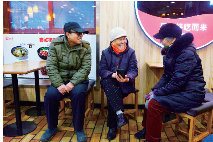
家长里短的事情街坊们都愿意和“教管家”聊聊。