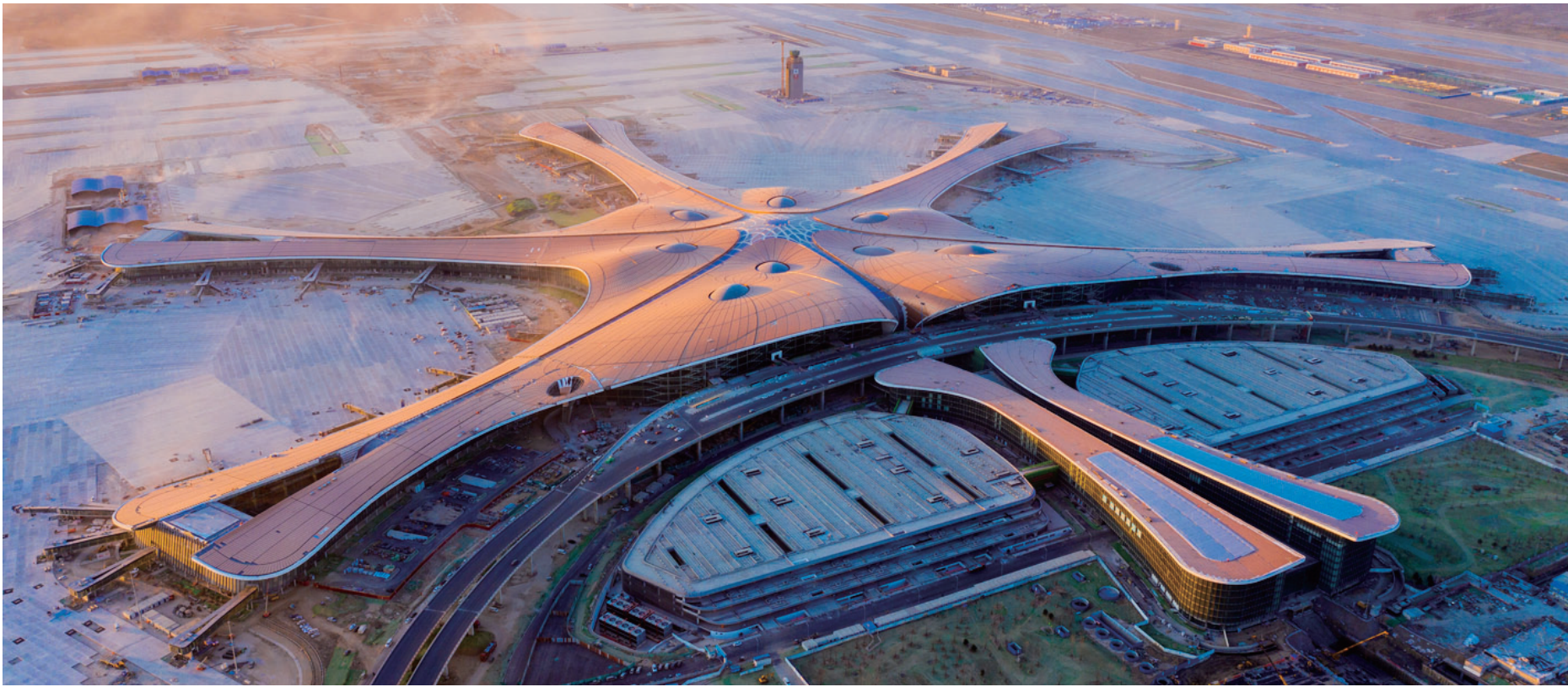
2019年1月8日，完成建设的北京大兴国际机场全景