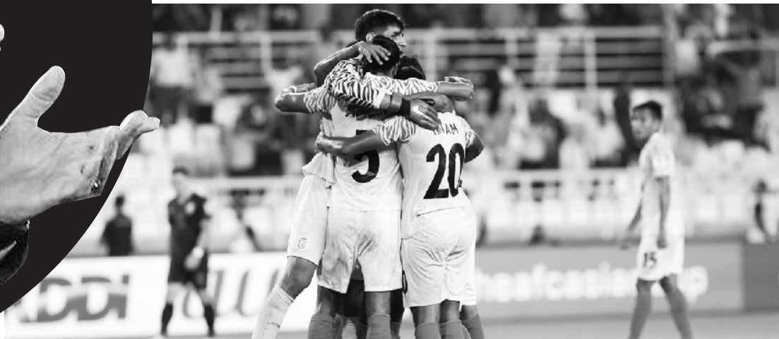
▲印度队在本届亚洲杯的表现令人印象深刻