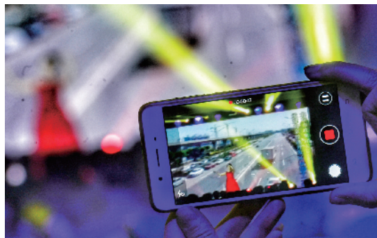
观众用手机录下精彩瞬间。