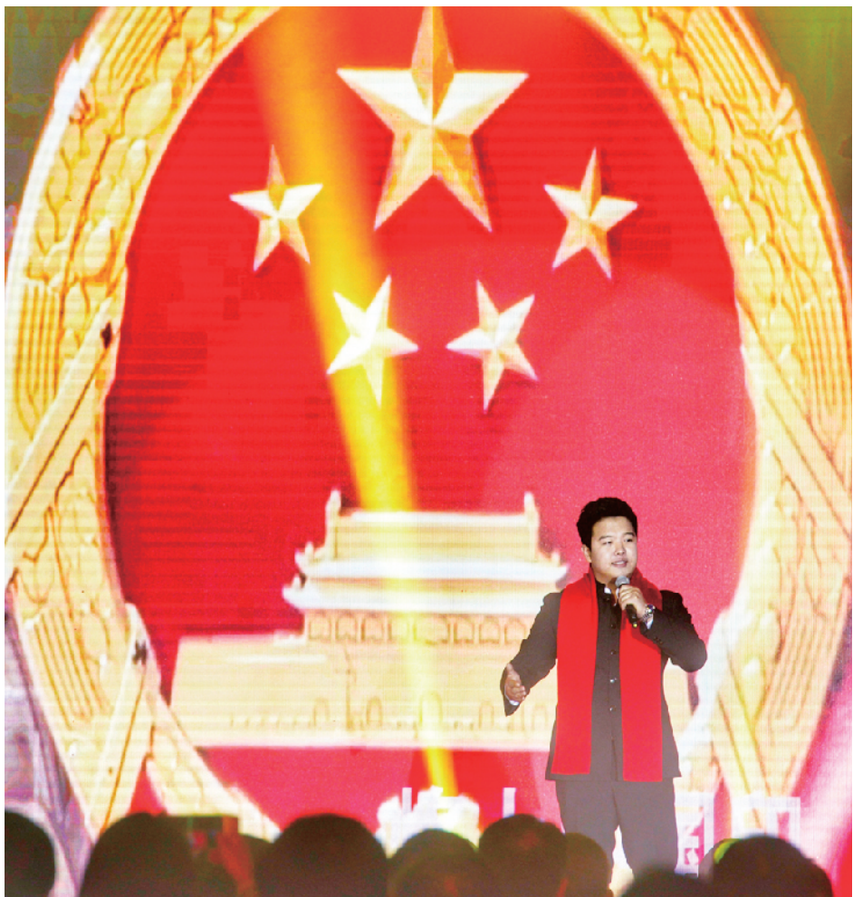
台上演员热情献唱。