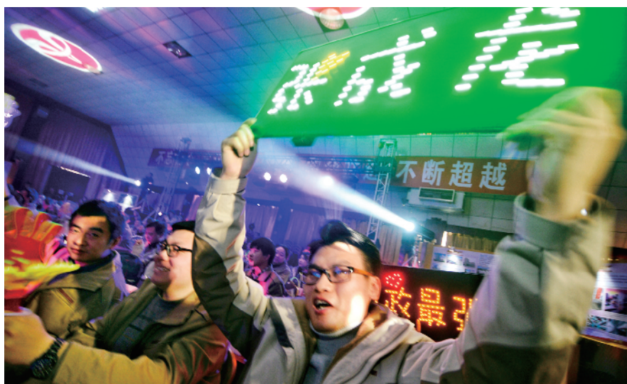
台下观众摇“旗”呐喊助威。