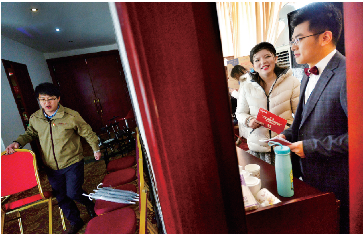
主持人早早来到现场对台词。

市政路桥工会相关负责人表示，工会努力让职工有更直接、更实在的获得感和幸福感，打造和合共进、不断超越的企业文化，建设多样化职工服务平台，形成具有代表性、一线职工能够广泛参与的文体活动。希望通过职工歌唱比赛的形式，进一步激发广大干部职工爱岗敬业、创新发展的热情和活力，高歌猛进，为集团公司圆满实现“十三五”规划目标吹响进军号，以更加饱满的激情和更加优异的成绩献礼伟大祖国七十华诞。