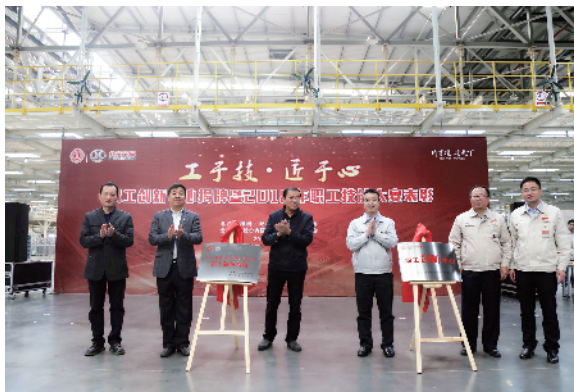
职工创新中心揭牌