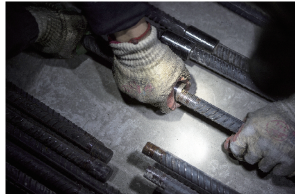
钢筋工人的双手每天要拧动螺丝1万多次。

北京至张家口之间的旅途时间将从现在的3.5小时缩短至1小时之内。该铁路也将为2022北京冬奥会、冬残奥会提供有力的交通支持。