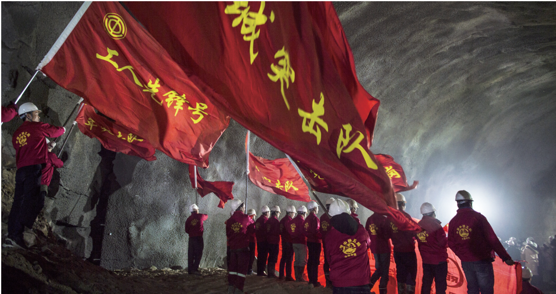
一声轰鸣过后，新八达岭隧道顺利贯通，工人们共同庆祝这一历史性的时刻。