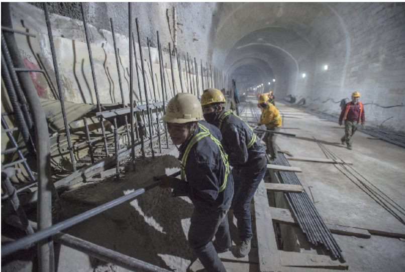
工人将十几米长的钢筋传递到隧道脚手架上。

再展京张风采”的理念，攻克了隧道浅埋、涌水、长大隧道通风等技术难关，三次安全顺利穿过了长城。