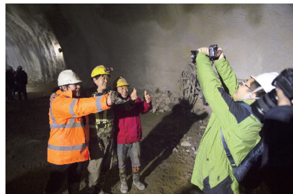
工人们在自己建设的隧道内合影留念。