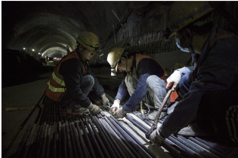
工人把钢筋用连接组件组装在一起。

另外，隧道穿越世界文化遗产——八达岭长城核心区域，按照相关环境、文物保护要求，施工地表需“零沉降”。除在技术上进行攻关创新外，中铁五局京张铁路项目部参建员工恪守“秉承天佑精神，