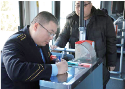
为顾客写下路线指示条