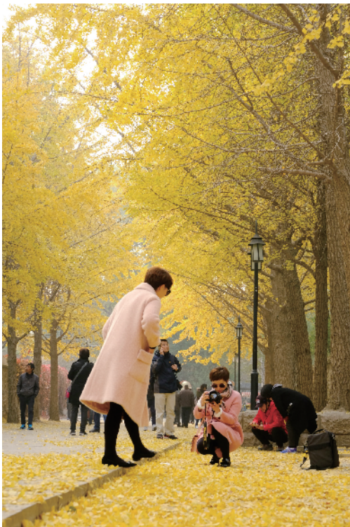
京城随处可见的银杏大道吸引年轻人尽情拍照。