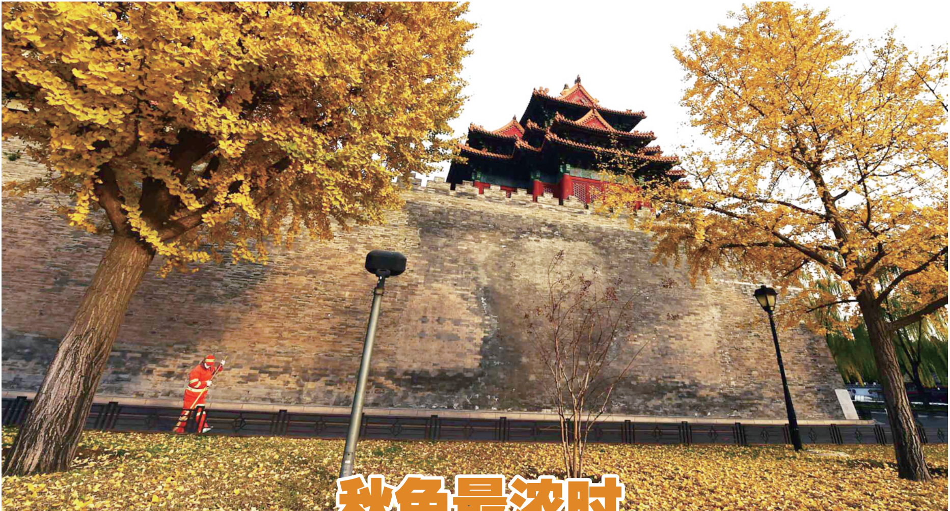
故宫城墙外环卫工人整修树叶大道供人观赏。