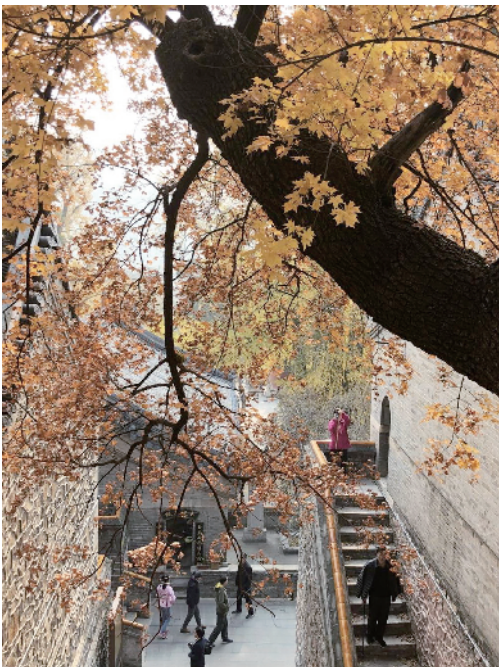
在京西潭柘寺火红的枫叶引得市民纷至沓来。