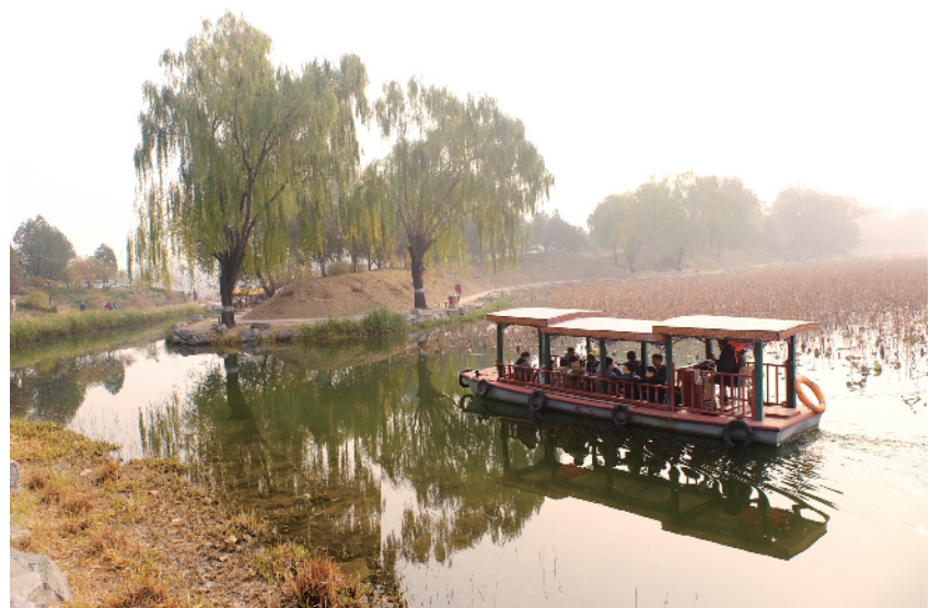
假日里,人们乘船观赏圆明园的秋色。