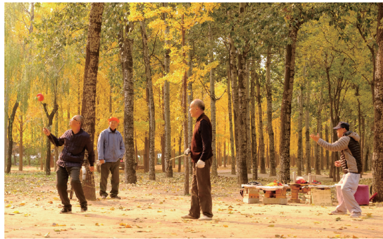
在大山子路旁街心花园银杏林,老人们正在晨练赏秋。