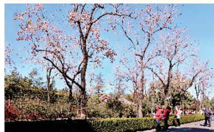
景山公园火红的柿子引人驻足观望。