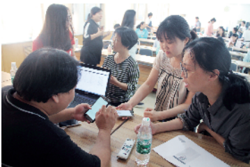
▼工作人员答疑解惑