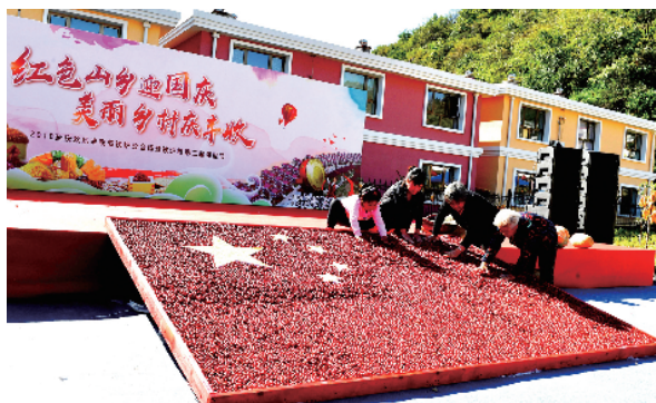
红色山乡大庄科村村民们用山楂铺绘国旗迎国庆。