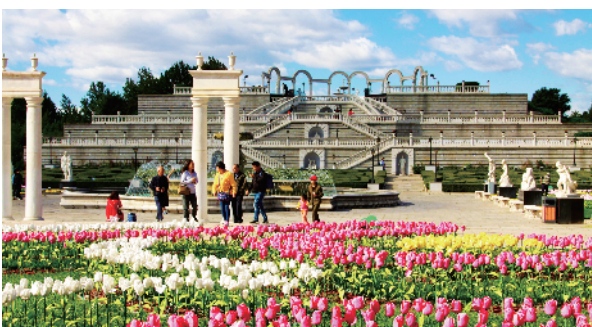
园林职工用鲜花将世界公园装扮得万紫千红。