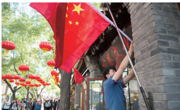
京城的大街小巷家家挂起了五星红旗。