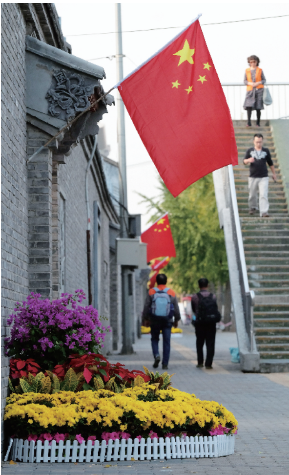
改造后的街头，鲜花伴人行，国旗迎风飘扬。