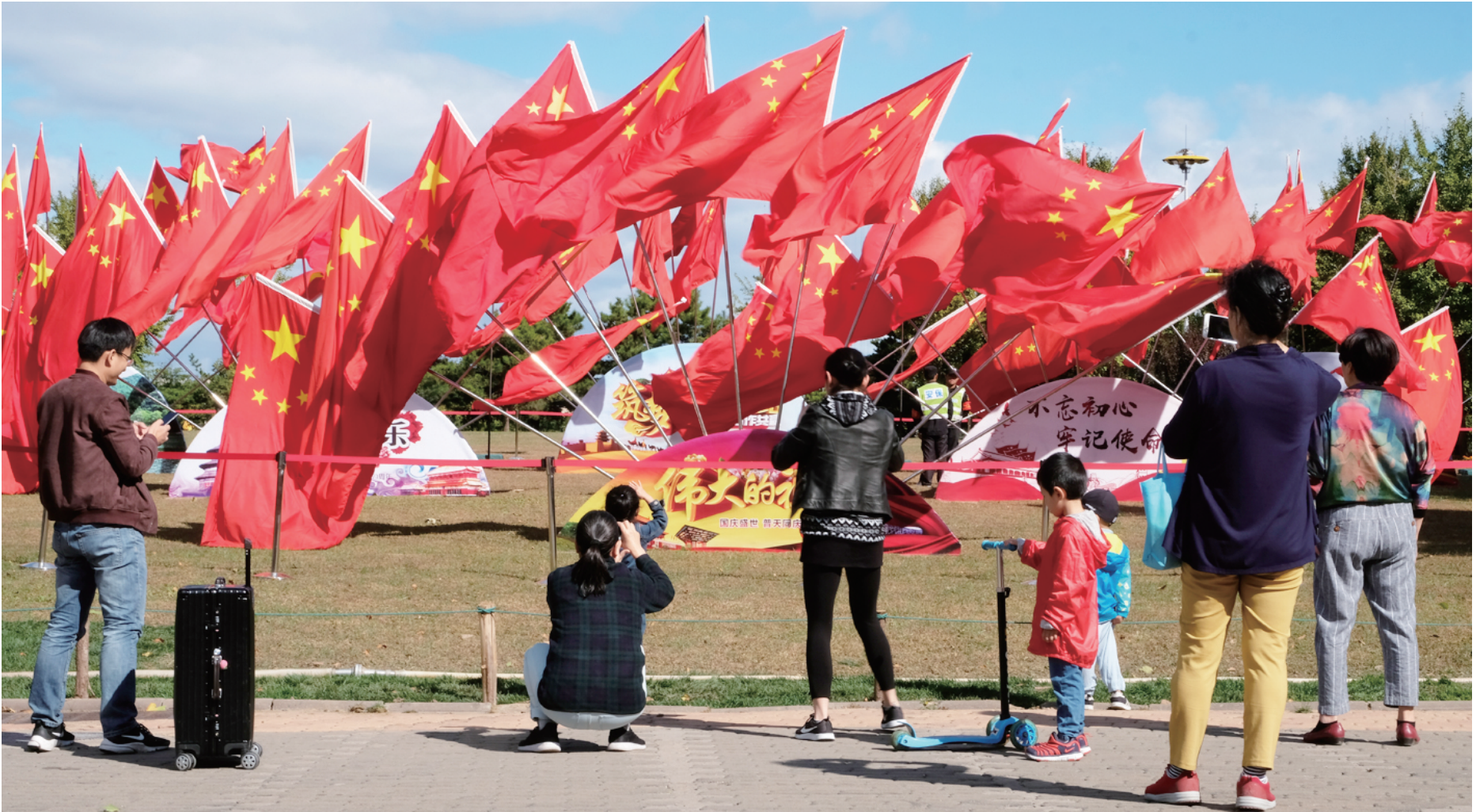
朝阳公园门口装点了69面五星红旗，引来人们驻足拍照。