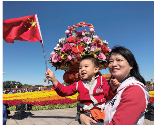
在天安门广场祝福祖国花坛前，孩子们在家长的怀抱中手挥国旗无比幸福。