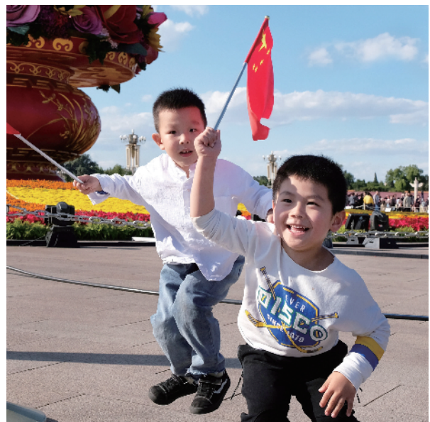
在天安门广场随处可见孩子们的笑脸。