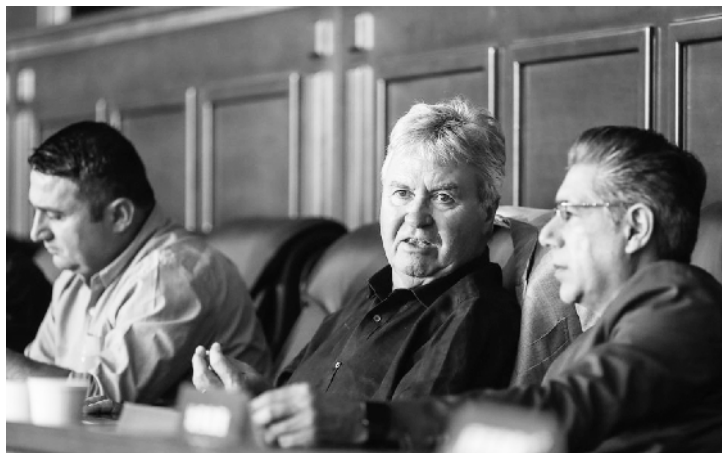
中国足协能够看上希丁克,更多是因为荷兰人在国字号球队上的成功经历,以及执教亚洲队成功的经历。希丁克曾经率荷兰

希丁克其实早已到岗,他一直在密切关注国奥队的动态,已经观看过国奥队的比赛。作为一位以严谨著称的世界名帅,希丁克需要更多了解中国适龄球员的情况。希丁克已经“归隐”多日,上一次在顶级赛场执教还是2年前临时代理切尔西主帅。中国足协能够把他请出来,去带一支青年队着实不易。要知道这些世界名帅,大部分是不屑于带国青队的,你去看看欧洲各国国奥队的教练岗位,根本找不到在职业赛场呼风唤雨的名字。