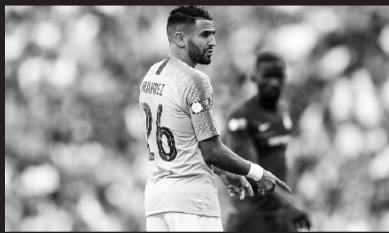
不甘寂寞的曼城中东财团砸钱引入马赫雷斯

新赛季英超联赛将于本周六重燃战火，各家豪门在夏季转会期屡有动作，加之一干新鲜力量同样在转会市场加大投入，使得新赛季的英超联赛竞争更加激烈。