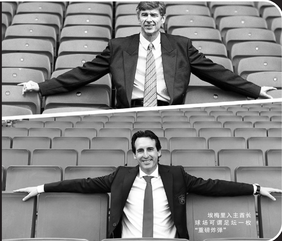
埃梅里入主酋长 球场可谓足坛一枚 “重磅炸弹”

同样在转会市场上动作不多的，还有曼城的同城死敌曼联。除2100万英镑引进葡萄牙年轻后卫达洛特外，曼联没有在转会市场上花掉一个便士。穆里尼奥在季前赛中尽遣年轻球员上场，华裔球员钟塔西更有惊艳表现。但球队在