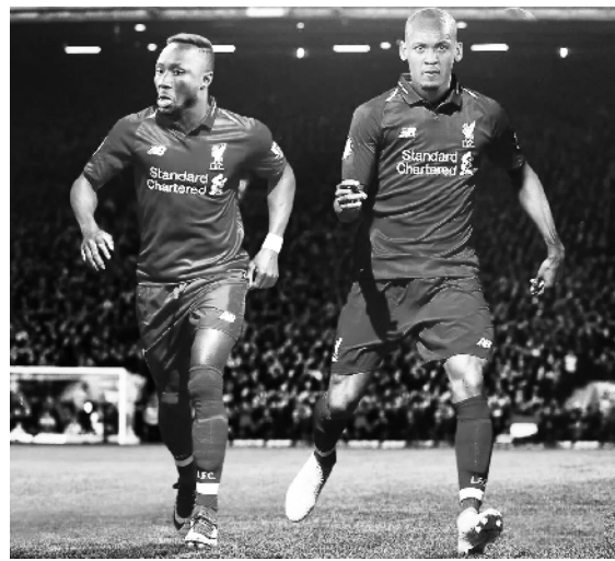
“渣叔”球队今夏动作不小