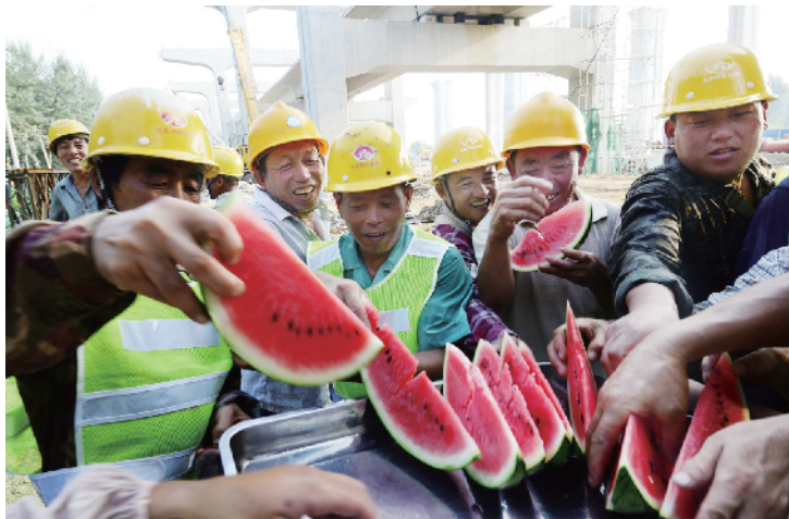
工会每天定时为一线工人送清凉饮料和西瓜。