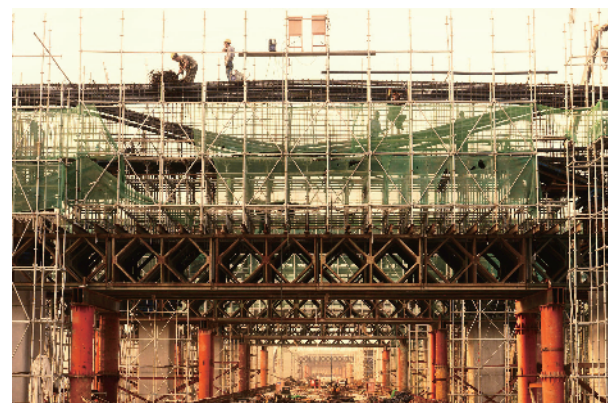
夕阳下的天气闷热，工人依然坚守岗位。

施工、安全、技术、后勤保障，工程的全速运转，将保证北京新机场线轨道共构段9月底桥通。