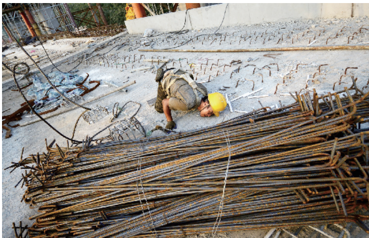
为吊装安全，工人趴在地上捆扎钢筋。