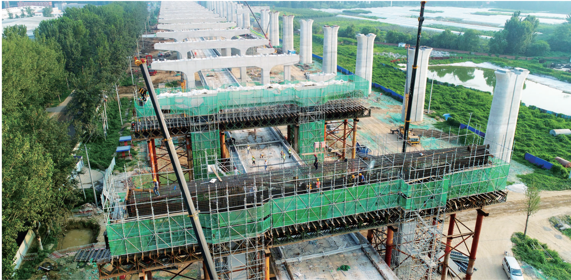
北京市政路桥总承包二部新机场线03标实现主体结构完工。