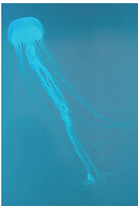
水母在水中游来游去

地出差了几天。临走前，特别叮嘱爸爸帮她照顾水母。“我给他说了怎么喂，怎么照顾。但是我一回来，真是心塞啊。死了不少，就剩三四个啦。那时的内心就只能用崩溃来形容啦。”