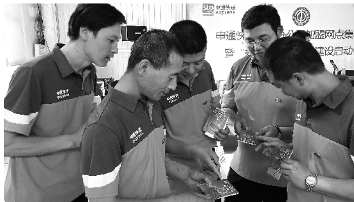
发展农民工入会作为工作重点,以“会站家”一体化建设为抓手,多措并举扩大工会组织覆盖