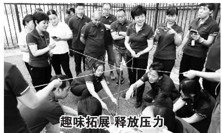
近日，北京市邮政教育培训中心工会开展教职工素质提升团队建设活动。参加活动的三个团队先后比拼了同心击鼓、巨人脚步、神笔马良、无敌风火轮和拔河五个项目。活动中，队员们相互鼓励、克服心理障碍，通过团结协作完成了一系列挑战。同时，在活动中也释放了工作压力。