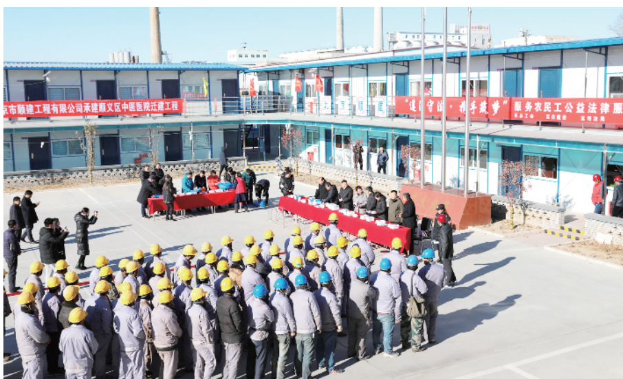
走进工地为农民工提供法律服务