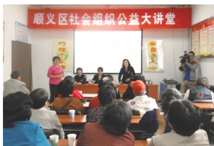
公益大讲堂走进社区