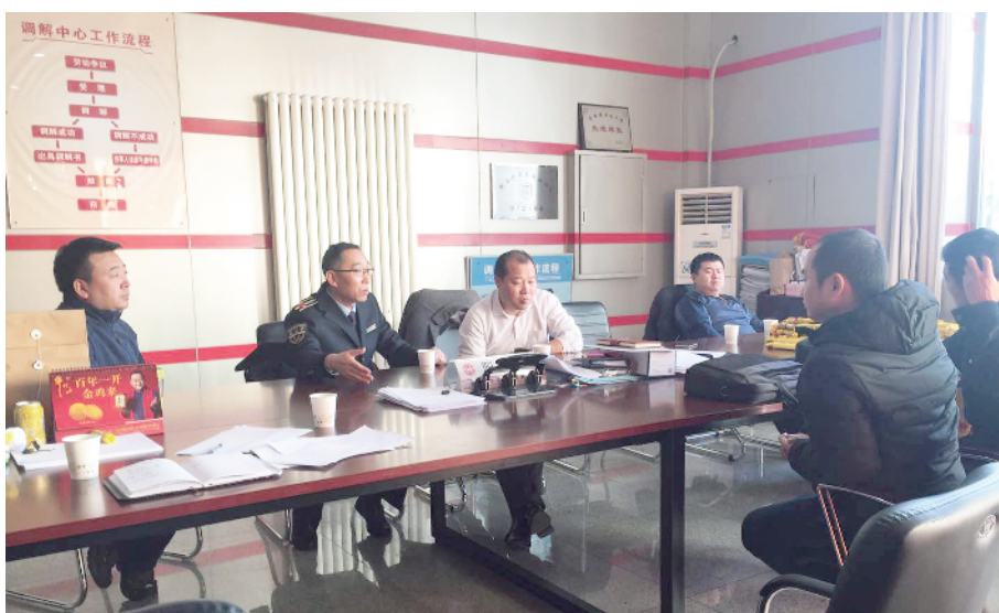
联合区劳动监察等职能部门共同解决重大劳动争议案件