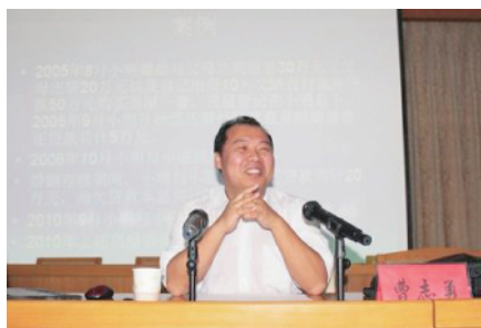
深入基层一线开展法律宣讲活动