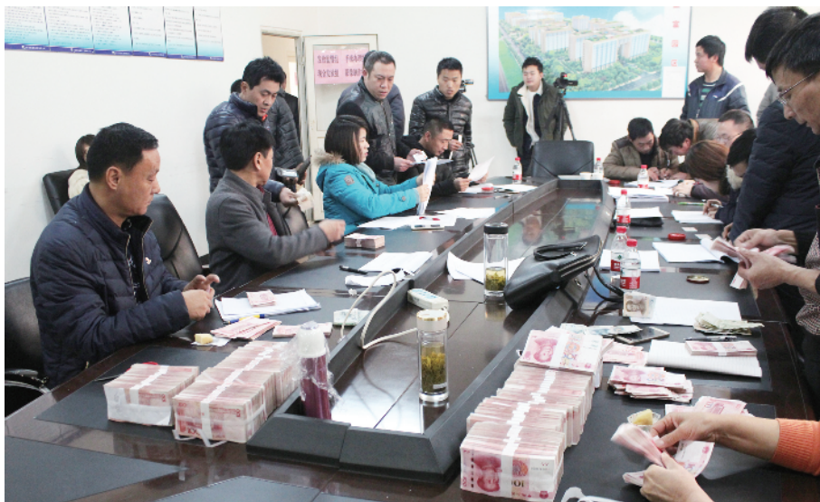
劳动纠纷调解成功 现场发放工资、赔偿金

从2018年年初开始，顺义区总工会启动了大规模职工群体访事件、突发性群体劳动争议事件的应急处置制度，一旦出现以上事件，各级工会领导干部第一时间到达现场，及时疏导解决。事件涉及人数30人以下的，区职工服务（帮扶）中心主任协同合作律所主任30分钟内到达现场，稳定职工情绪，组织疏导稳定工作；事件涉及人数30人以上的，主管副主席30分钟内到达现场，及时联系劳动监察等职能部门共同协调解决，尽快平息事态。对于调解不能达成一致的，对于切实侵害职工合法权益的，将派专家引导职工进入司法程序，为职工提供无偿的法律援助。