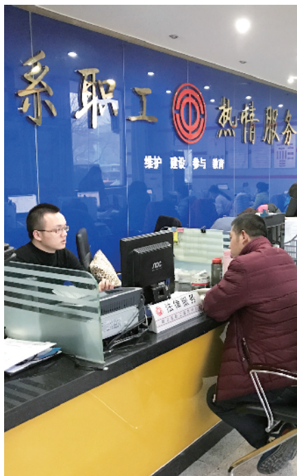
免费为职工提供法律咨询服务