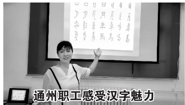
通州职工感受汉字魅力

近日,通州多源商贸公司举办了“绽放的汉字”系列文化活动。活动通过讲述汉字的起源及演变过程再现汉字发展历史;共同分享和汉字有关的趣闻趣事,让大家了解汉字文化的博大精深;汉字书法比赛从一撇一捺的笔画中让大家感受汉字的内涵精髓。丰富多彩的内容使职工深刻感受到汉字的魅力。