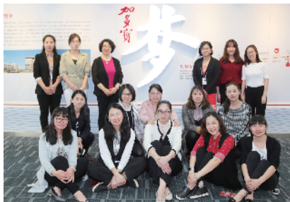
加多宝(中国)饮料有限公司

加多宝(中国)饮料有限公司主要从事饮料生产及销售,旗下产品包括罐装、瓶装、盒装“加多宝凉茶”和“昆仑山雪山矿泉水”。为了能够让消费者喝上统一配方、同一口味的凉茶,加多宝在保持凉茶原有口味的基础上,在包装形式、工艺流程等方面进行了创新。20年来,加多宝主动承担社会责任,在国家自然灾害中累计捐款超过3亿元;连续17年开展“加多宝·学子情”爱心助学行动,累计捐款8000万元,帮助万余名贫困学子圆梦大学。此外加多宝关爱员工、维护员工的合法权益为员工签订集体合同、注重企业文化建设,不断丰富员工业余文化生活,为创建和谐向上、充满活力的团队奠定坚实基础。