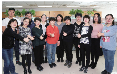
北京经济技术开发区财务结算中心行政事业核算组

作为北京经济技术开发区管理委员会的财务部门,财务结算中心行政事业核算组担负着70多个行政事业单位的会计核算、会计档案管理等具体工作。在繁重的工作任务和岗位职责压力面前,财务结算中心行政事业核算组履职尽责,圆满完成了各项财务工作。年底结账月历来是财务结算中心行政事业核算组的最忙月,为了在规定结账日期之前顺利完成工作,每个人都牺牲休息时间主动加班加点干活,领导更是跟大家“并肩作战”,无论加班到多晚,领导都全程陪同。工作人员在完成自己手头工作之余,热心积极帮助其他同事,明确分工、有条不紊,最终顺利完成各项任务,并且每一笔支出都做到了准确、及时、无误。