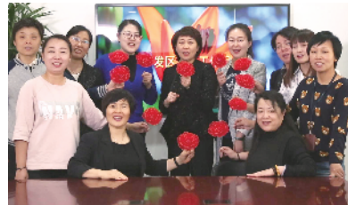
北京经济技术开发区总工会女职工委员会

开发区女工委成立于2011年5月,成员13人,其中有11人是来自开发区各企业的女工干部。六年来,她们的辛勤劳动,换来了开发区女工委工作的累累硕果,她们不忘初心,砥砺前行,撸起袖子加油干,全力打造“六大平台”,倾情助推女职工工作,并为推动女职工工作全面发展打下了坚实的基础。女工委将以十九大精神为指引,不断增强研究和解决问题的能力,积极迎接挑战、勇于担当重任、努力改革创新,使更多的女职工受益、让更多的女职工满意,不断推动工会女职工工作迈向新的台阶。