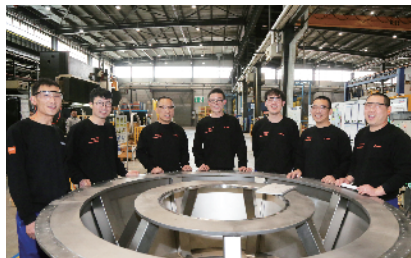
西得乐机械(北京)有限公司大件制造车间

开发区女工委成立于2011年5月,成员13人,其中有11人是来自开发区各企业的女工干部。六年来,她们的辛勤劳动,换来了开发区女工委工作的累累硕果,她们不忘初心,砥砺前行,撸起袖子加油干,全力打造“六大平台”,倾情助推女职工工作,并为推动女职工工作全面发展打下了坚实的基础。女工委将以十九大精神为指引,不断增强研究和解决问题的能力,积极迎接挑战、勇于担当重任、努力改革创新,使更多的女职工受益、让更多的女职工满意,不断推动工会女职工工作迈向新的台阶。