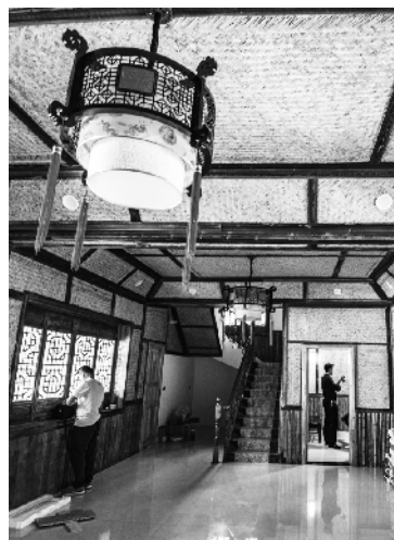
堰河村一接近完成装修的仿古别墅的客厅。

湖北省谷城县五山镇堰河村位于十堰市与襄阳市交界处的深山里。改革开放后，尤其是从20世纪90年代开始，堰河村致力于发展生态经济，靠种植无公害茶叶、发展山村旅游等项目致富。日子好过了，村委会请来专家对村落进行精心设计和规划，以生态环保、舒适宜居为基本理念指导农户建设新居。在堰河村，村民按照时间顺序将村里的民居变化分成了五代：分别为土坯房、砖木结构楼房、实心墙结构楼房、砖混结构楼房以及新型仿古别墅。经过多年建设，一个风貌古朴、功能现代、产业有机、文明复归的堰河村展现出来。