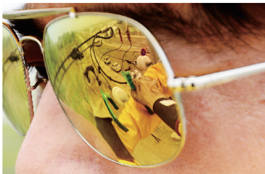
戴墨镜不是为了耍酷，是为了确保工作安全。