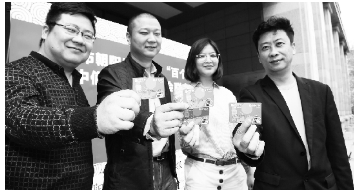
朝阳区工会会员的特殊身份,也是百个项目的重要成果。希望把

据区总工会职工服务(帮扶)中心负责人介绍,工会会员专属联名服务卡是朝阳区总工会与中信银行联名发布的,不仅彰显了