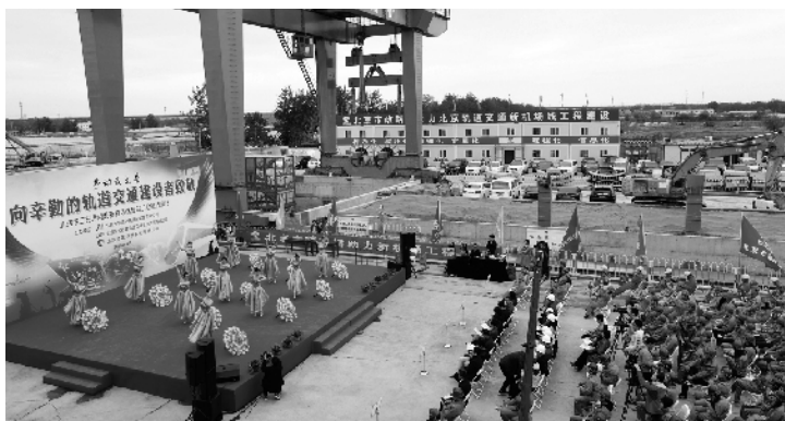
交通服务,实现“半小时”到达中心城市目标。项目定位为机场专线,

据了解,新机场线是京津冀协同发展建设战略项目的一部分,是北京新机场配套交通工程。其主要功能是提供新机场与中心城区之间快速、直达、大运量的公共