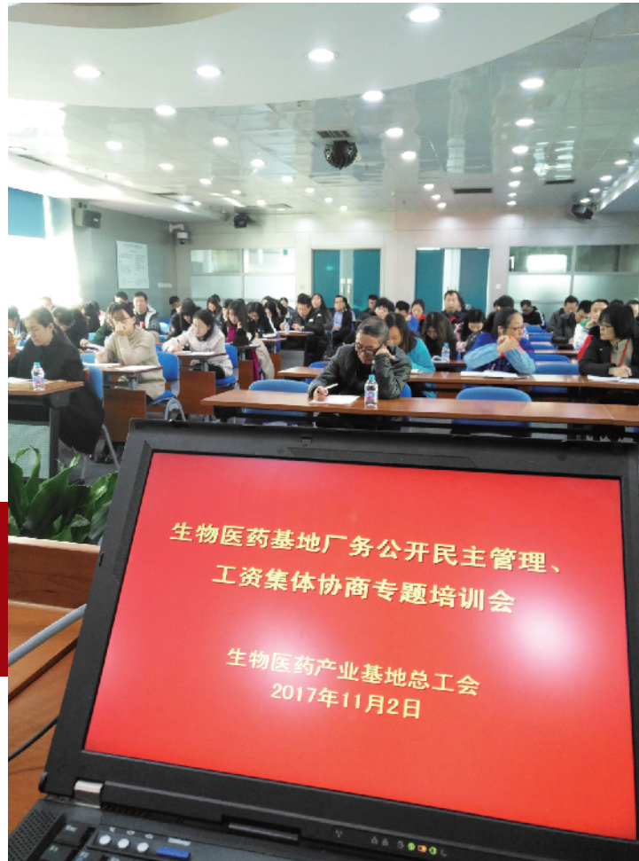
生物医药基地召开集体协商、民主管理培训会

2018年是《北京市工会深入推进集体协商行动计划（2015年-2018年）》的收官之年。在落实《行动计划》的基础上，大兴区总工会按照“巩固协商成果，推进规范建制，提高协商质量，增强合同实效”的工作思路，通过“四必谈”、集体协商量化评估、培育典型、加强队伍建设等工作，积极推进辖区集体协商工作规范、提质、增效、创新。截至目前，大兴区建有工会组织的企业99%建立了集体协商制度。