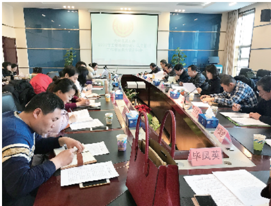
区总工会2017年工资集体协商、民主管理 工作考核采片组会现场