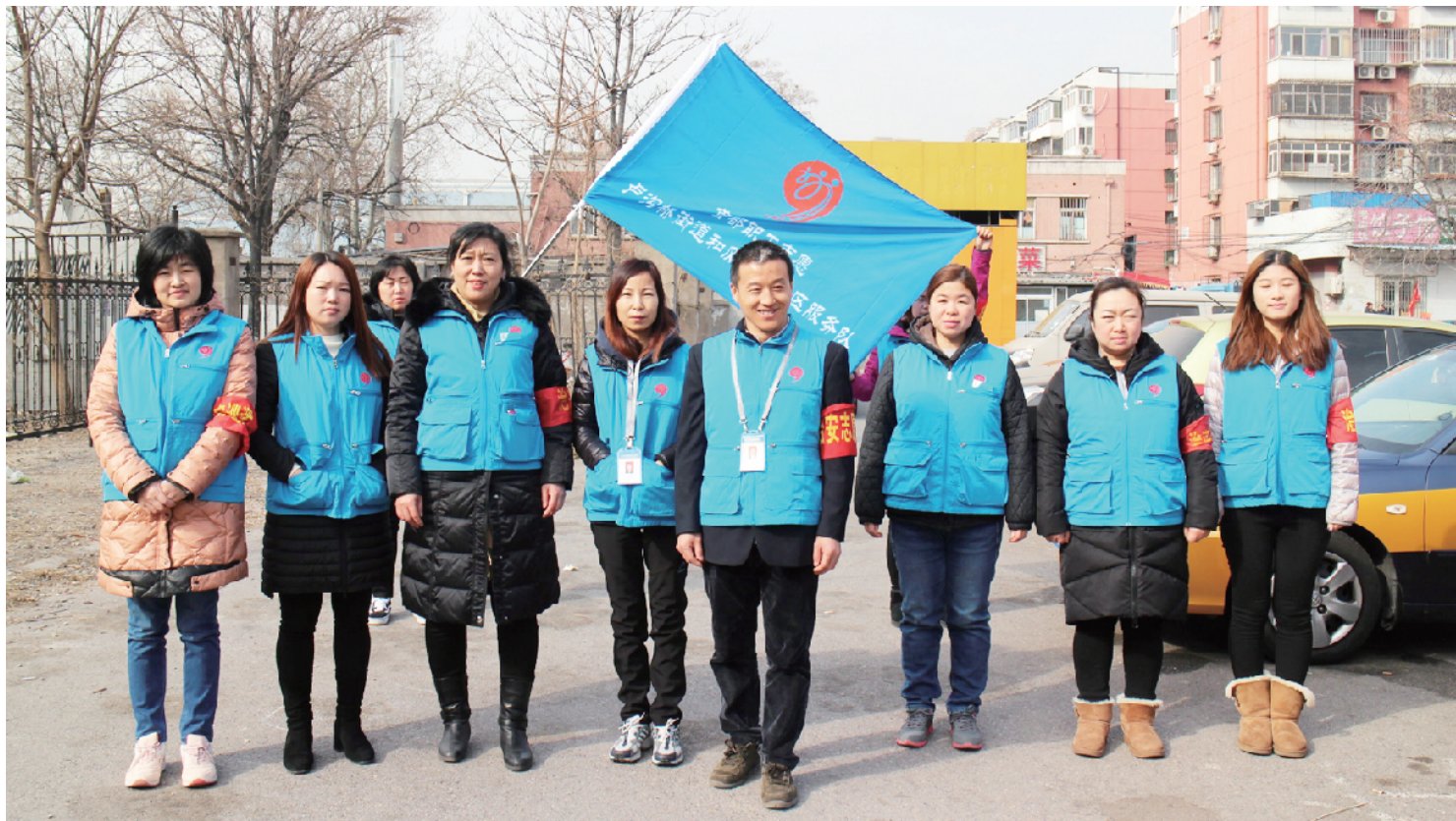
组织职工志愿者开展义务巡逻保辖区安全