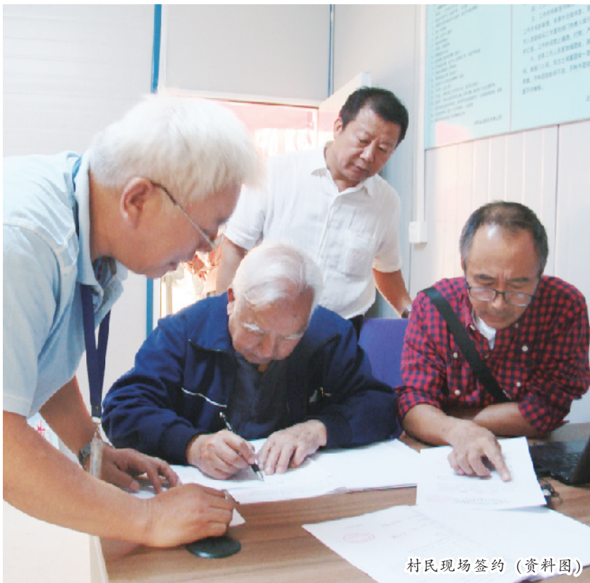
村民现场签约（资料图）

门没公交，到处是隐患”——这是看丹村老百姓过去几十年生活的真实写照。那时候的看丹村，是中组部挂账的经济落后村，是北京市一百个重点整治地区，在政府和各部门的关心帮助和全面协调下，随着看丹村棚户区改造和环境整治项目的启动和地铁16号线看丹站的正式开工建设，一系列的问题终于得到了彻底改善。