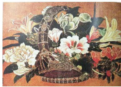
南宋·李嵩的花篮图

宋代是中国插花艺术的鼎盛时期。经过五代战乱后,国家统一,政局稳定,民心思定,国富民强,人民将赏花作为一年中的“赏心乐事”。在宋代“文人四艺”(琴、棋、书、画)之外又形成了生活四艺(插花、焚香、点茶、挂画),将视觉美、嗅觉美和味觉美融为一体,形成了多层次的艺术享受。