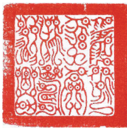
后人仿制的传国玺： 受命于天，既寿永昌