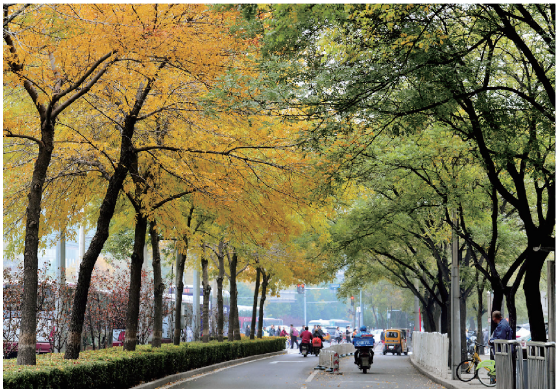
广安路两旁树叶的颜色黄绿各半。