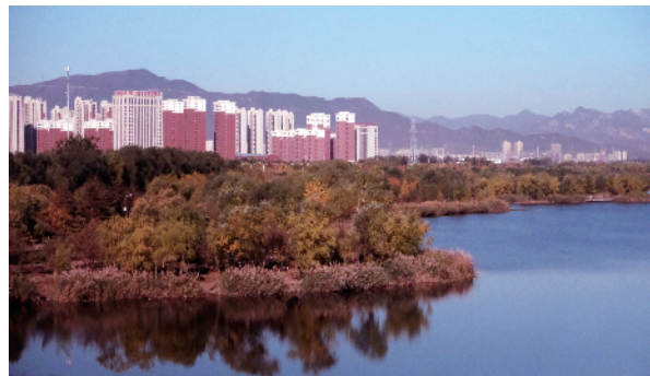
永定河畔的秋韵把家园装扮的美如画卷。