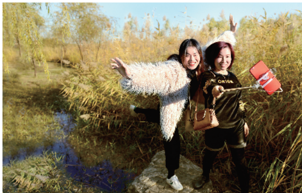
奥森公园大片金色的芦苇荡吸引着市民游玩儿。