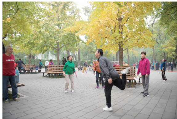
秋意浓浓的街心花园是人们锻炼身体的好去处。