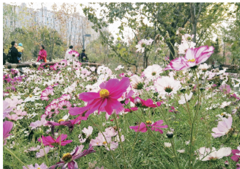
菜市口城市森林的小花为秋天增添了份妩媚。