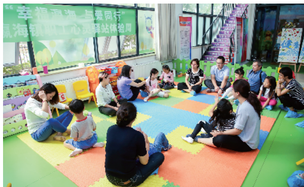
职工与孩子参与亲子互动活动