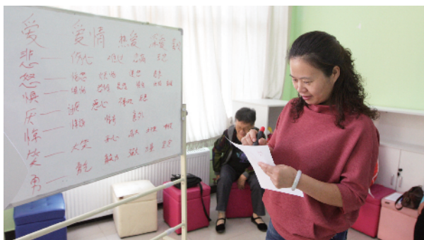
情感互动中，职工写下自己的情绪。

“在人际交往中，我们从对方的语言和肢体动作中能够感受到什么样的情绪？我们所感受到的情绪是否是对方想表达给我们的东西？”在瀛海镇总工会举办的职工心灵驿站体验周活动之“两性情感·亲密关系图卡”主题沙龙上，来自北京市市心启航公益服务中心的心理辅导老师向在座职工提出了这样的疑问。