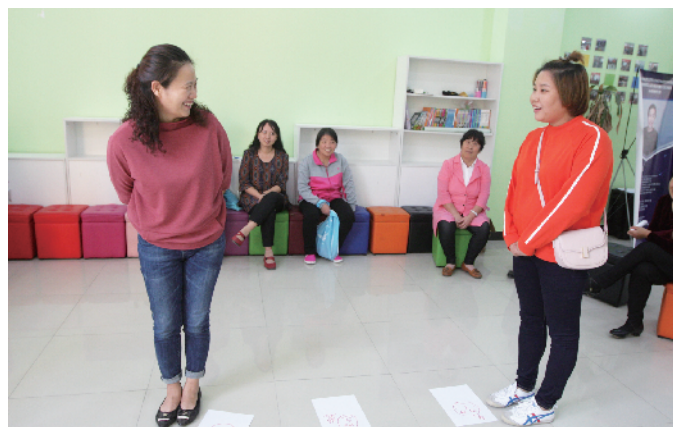
▲职工参与情感互动活动