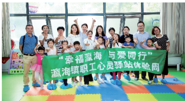
亲子互动参与者合影