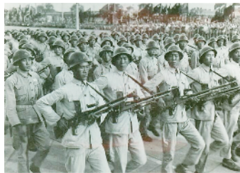
开国大典时受检阅的步兵方队