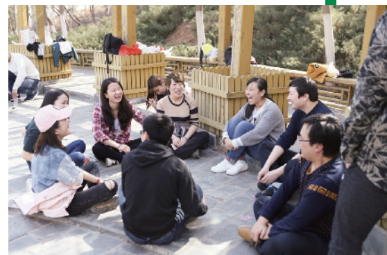
工会组织职工爬山郊游