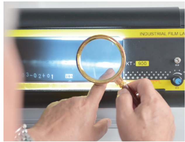
裁判通过X光片查看评比焊接选手的作品。