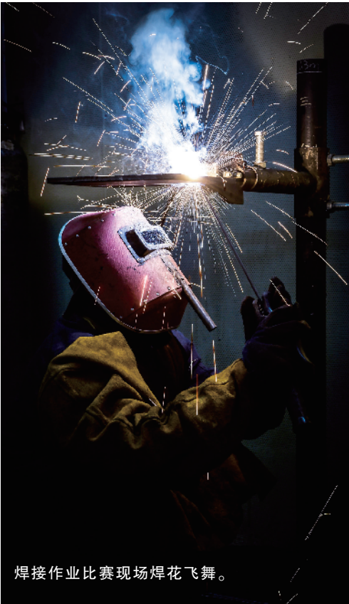
焊接作业比赛现场焊花飞舞。