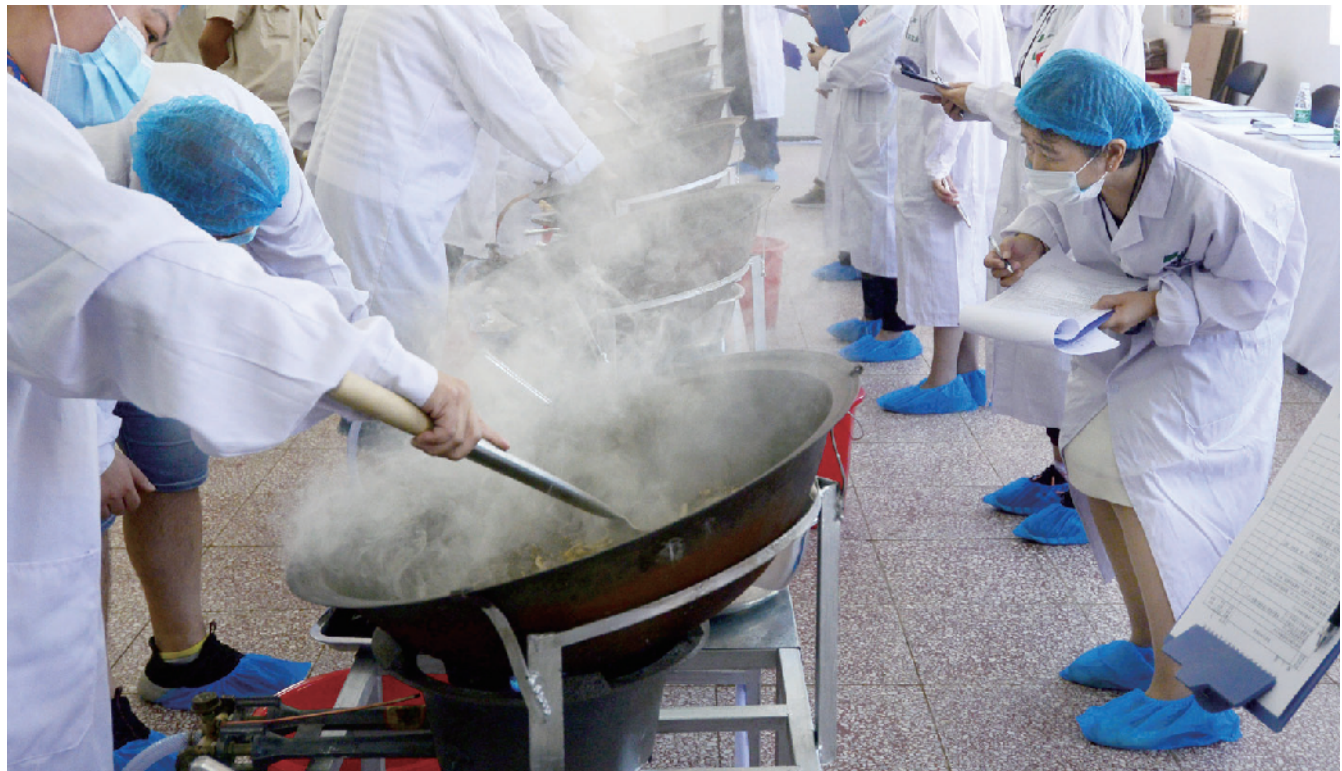
专家评委紧盯选手中药炒制的每一步操作。

目前，挑战者选拔赛第一阶段赛事已完成，第二阶段的比赛将在10月下旬完成。届时，从选拔赛胜出的终极挑战者将与种子选手进行10场北京“大工匠”挑战赛，比赛时间预计在11月举行。