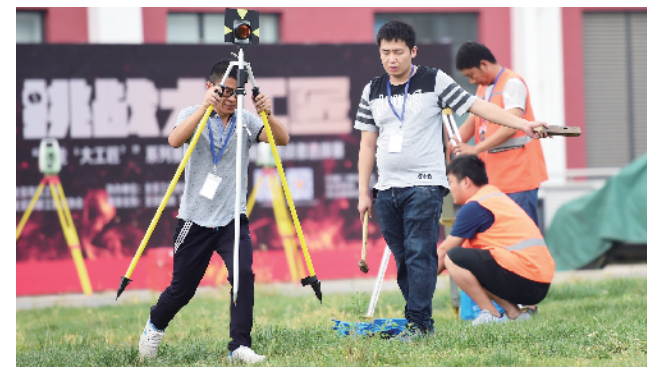
测绘比拼的就是细心，做到分毫不差。