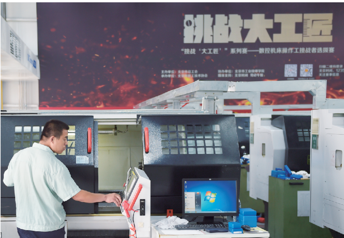
数控机床组的选手，对机床进行数据设置。