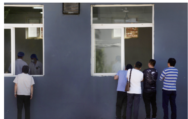
比赛吸引了药厂的职工前来观摩。