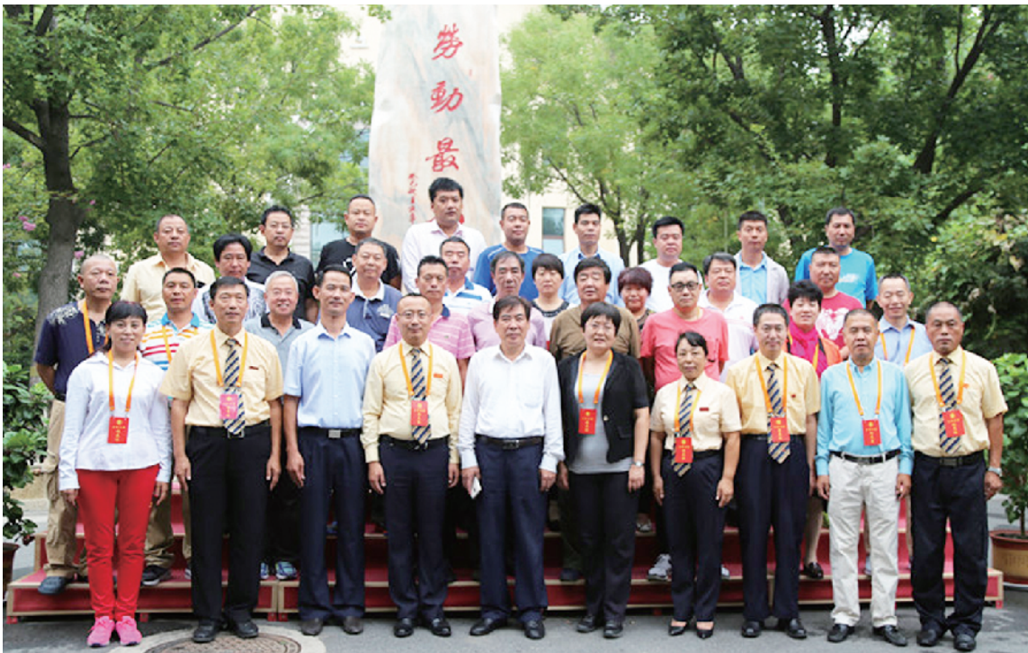
“劳动最光荣”石碑前合影。