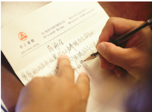
感动很多，写封感谢信。