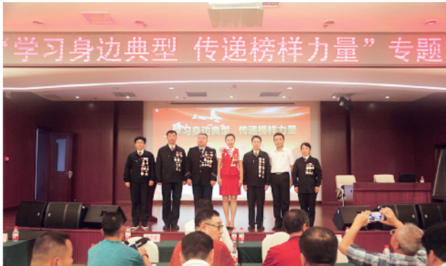
宣讲成员集体亮相。