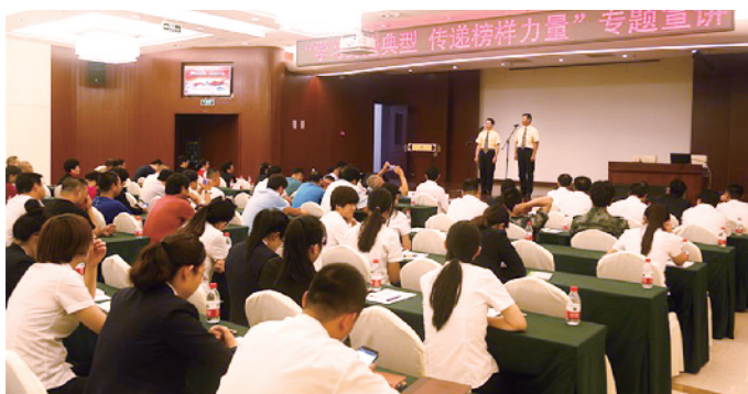
“学习身边典型，传递榜样力量”主题宣讲。