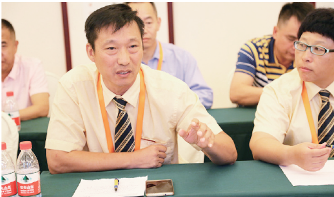
座谈会上，劳模们畅所欲言。

在休养活动中，劳模们交流学习和工作心得，大家相互学习、相互帮助，彼此建立了友谊。在放松心情同时，缓解了平日的工作压力。此次劳模休养活动以独特创新的形式圆满结束，得到了劳模师傅和疗养院领导的一致认可和好评。