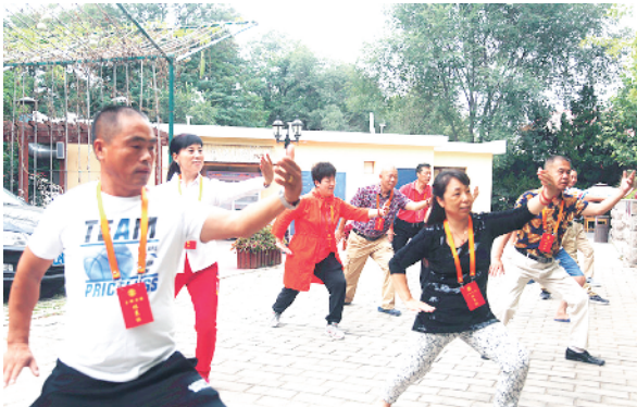
休养时每天一早坚持打太极。