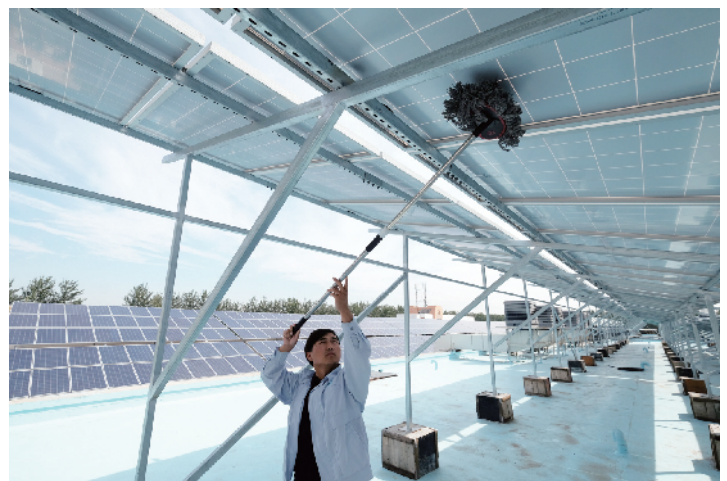
在厂区的自行车和汽车棚及车间顶都是用太阳能板搭建的，每年可以发电9万度。