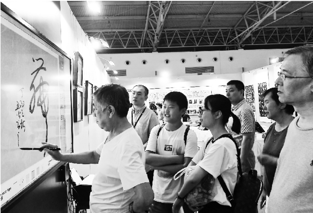
在第五届北京文学艺术品展示会上，一位市民在电脑上奋笔疾书。