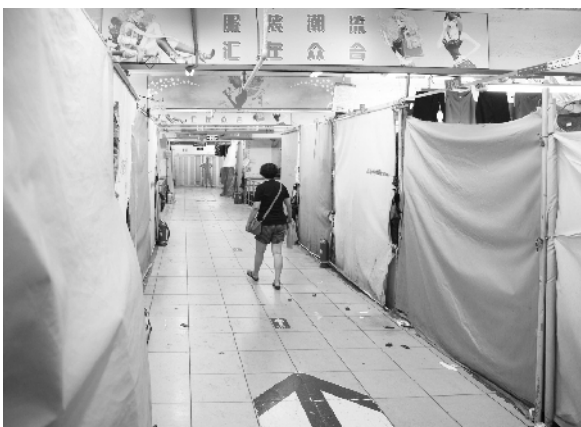
很多商户已经提前撤出市场。