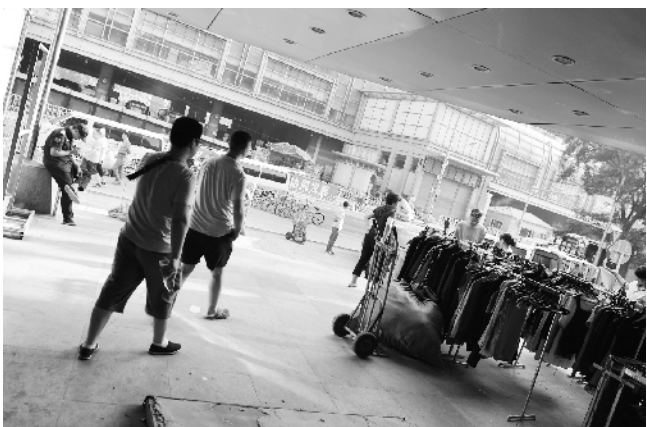
下午4点，很多商户把服装推出市场开始打包。