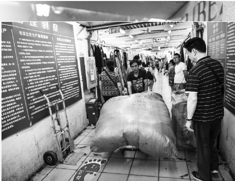
下午临近关门时，商户开始打包撤离市场。