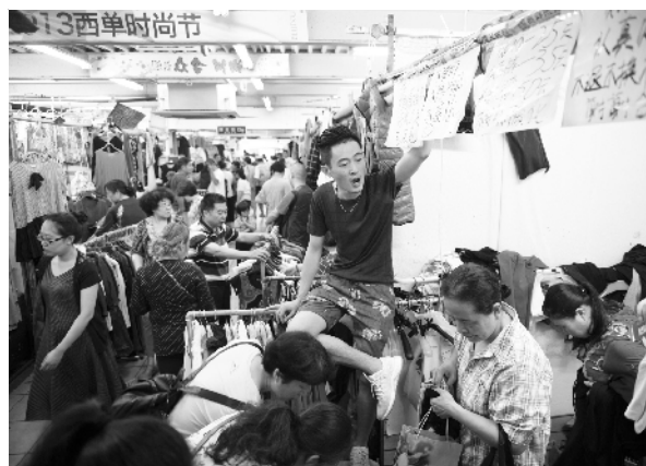
商户老板在摊位上都挂上了“甩货”“清仓”字样。