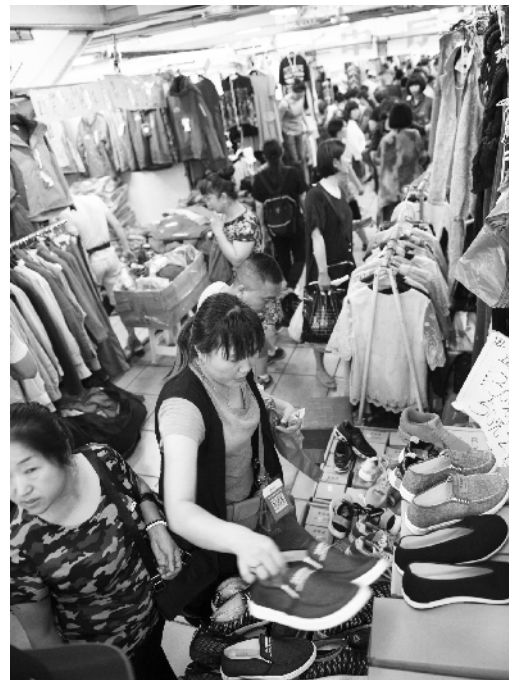
下午，很多商户开始收拾自己的商品。

“动批”众合市场建筑面积8838平方米，摊位数629个，从业人员1887人。从1999年11月开业至今已经经营18年，以韩式服装最为出名。在前往众合市场的过程中，记者发现市场东侧的万容天地商场内已空无一人，里面各式各样的空摊位尚待清理，贴在大门的公告上表示此商场已于7月5日正式停止营业，门前也挂了“停止营业”的牌子，而旁边的世纪天乐大楼仍在营业。门口工作人员向记者介绍，在北京“动批”区域的12个市场当中，众合市场是第9个张贴疏散公告的，也是今年第4个进行疏散的市场。到目前为止，“动批”还剩天河白马、世纪天乐、东鼎三个市场尚未疏散工作。