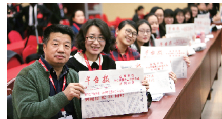
丰台区新闻中心总编室 跑在宣传一线的队伍

进入了水泵房，紧急维修解决故障，避免了小区生活停水及污水横流事故。公司生产班组的工作人员以实际行动诠释了“急用户所急，想用户所想”的企业理念。