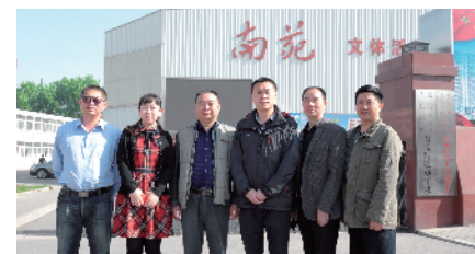
南苑街道社会治安综合治理办公室 全力推进“平安南苑”建设

丰台区新闻中心总编室通过宣传有力助推了丰台区党建、疏解等中心工作，圆满完成各项工作任务。总编室注重选题的系统性、持续性，增加宣传效果突出宣传主题。总编室认真梳理出党建、“十三五”开局等六个方面年度新闻宣传重点并开辟专栏聚焦。同时，在《丰台报》增加人物采访等，通过讲述丰台故事，传递正能量。对报纸、电视、广播等传统媒体与官微、手机报、微信、“今日头条号”等新媒体进行有机融合，将新闻宣传总结成工作流程，形成经验：前期新闻线索筛选、挖掘、策划，现场采访新媒体抢先发声预热，随后传统媒体全覆盖，重点题材深入持续。可以说，总编室是一支能打硬仗的工人先锋队。