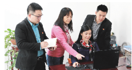
丰台纪律检查委员会组织部 全力推进干部队伍建设

(简称“综治办”)负责南苑街道辖区的社会治安综合治理，牵头非首都功能疏解相关工作，为辖区的安全和社会稳定做出突出贡献。工作中，综治办结合辖区实际，以“抓住重点、分级联动、因情施策”为原则，以清理整顿出租大院为抓手，疏解清退和人口调控工作有序推进。此外，综治办在环境整治和清洁空气行动中，主动作为，积极探索环境整治“四联”工作法，将经常抓与专项治理相结合、常态抓与特殊管相结合、普遍抓与精细控相结合，形成环境整治齐抓共管的良好氛围。与此同时，综治办以加强立体化治安防控体系建设为重点，以提升群众安全感为主线，抓好社会治安重点整治，努力提升流动人口服务的综合水平，全力推进“平安南苑”建设。