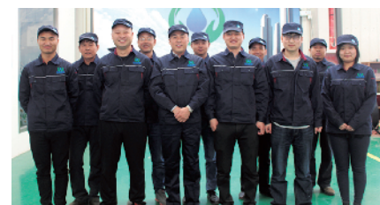
同力华盛环保供水公司生产班组 急用户所急 想用户所想

长辛店镇农业服务中心林业站致力于全镇生态建设，使长辛店镇多次被评为首都绿化美化先进单位、北京市森林防火先进集体。该林业站自主建设的中华名枣庄园被评为京郊农业现代化先进标准化生产示范基地、北京市果树产业发展先进单位等。自2012年以来，完成4574亩平原造林任务，栽植各类乔灌木21万余株，打造出300亩药用林、1400余亩彩叶林和彩叶大道等特色精品工程。该林业站发展全镇大枣事业，长辛店白枣在2006年北京奥运会果品推荐评选中获得了“一等奖”和“中华名果”的称号，并获得国家地理标志商标权。