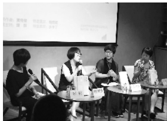
单向街书店阅读分享会

坐坐,也不错。”不少人白天为各种工作而忙碌,晚上书店按时打烊,这样的时间表,让很多人错过阅读的时间。2014年4月18日开始,三联韬奋书店正式开启“不打烊书店”。全天24小时不打烊的模式,满足不少书虫夜间的阅读欲。