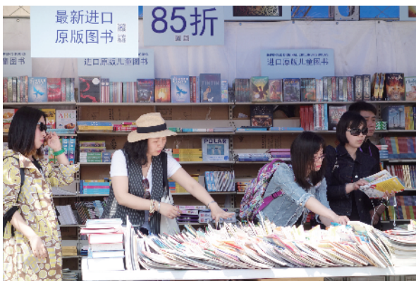
进口原版图书受年轻人青睐。