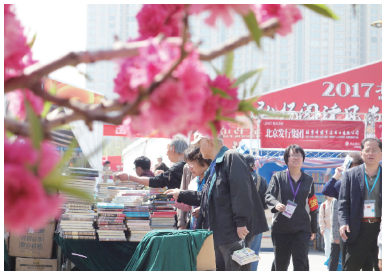
春天里绽放的花儿，迎接读者们的到来。