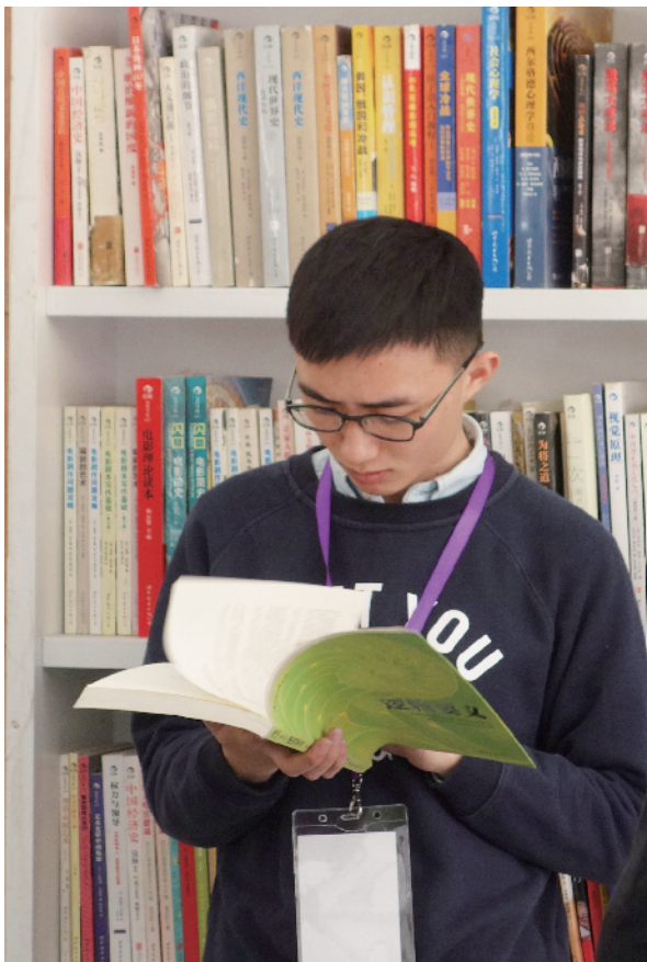
来书市淘书的年轻人在书海里如痴如醉。