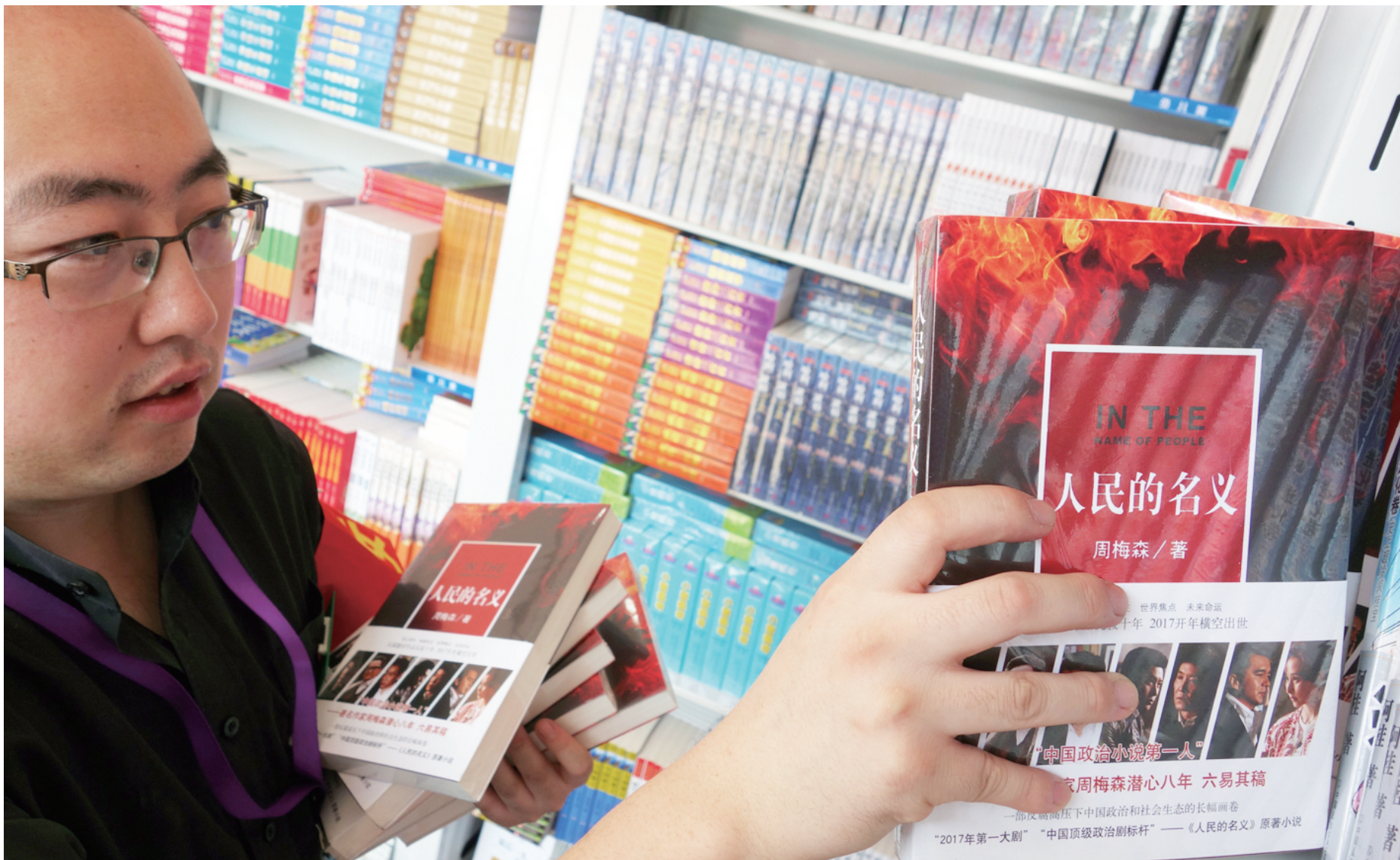
热播电视剧《人民的名义》同名小说受到热捧。