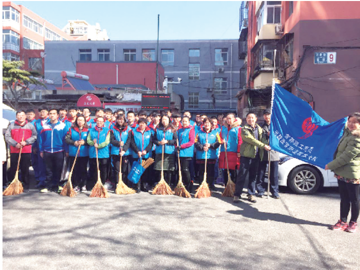
带领首都职工志愿者开展清洁家园美化丰台活动

值得一提的是对北京华帝燃具销售有限公司进行职工维权的过程中，通过街道总工会多次上门走访，指导企业开展集体合同的签订，赢得了企业方和职工方的认可。顺利为这家三百多人的企业建立了工会组织。工会主席高兴地说：“加入了工会，感觉我们职工也有了自己的组织，还能享受到好多会员福利，工作中也有了保障，关键是还增加了我