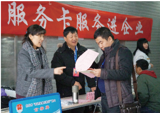
配合职工服务中心共同做好京卡·互助服务卡的宣传工作

工会来建会，都会从物业表格里面进行筛选、核实。若工会干部和我一起下企业，这样更容易开展工会工作。”在走访企业过程中发现，如果直接去敲开企业的大门找负责人谈建会，多半会被拒绝，如果有社区或者物业的熟人同去，就会赢得企业的信任，为建会打下良好的基础。