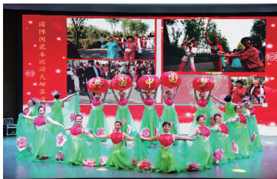
花乡地区总工会举办“五月的鲜花”文艺汇演

制，创新工作载体，全面推进新时期劳动关系和谐企业建设。一是加强民主管理和民主监督工作，大力完善职代会、厂务公开制度。目前，全乡各村属集体企业中，普遍建立和完善了职代会制度，全乡非公建会企业职代会建制率达90%以上。二是进一步规范平等协商集体合同制度，指导企业与职工及时签订《集体合同》、《工资专项协议》，维护企业和谐稳定的劳动关系。去年里，经过3个多月的不懈努力，共指导全乡15个村和总公司的123个企业完成了签订、续订工作，覆盖职工11172名。还指导20家非公独立建会企业与覆盖的781名职工完成了签订。(工资协商企业共143家，覆盖职工11953人)工资协商和集体合同签约率，都达到了90%的预定目标。