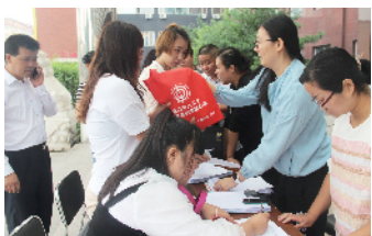
花乡地区总工会组织开展职工沟通会，增进职工对工会的了解

面对城市化建设进程中全乡各类企业职工队伍结构的新变化，按照主动、依法、科学维权的新要求，花乡工会不断完善机