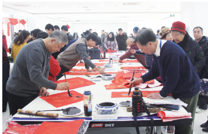
花乡地区总工会携手区老年书画协会为职工写春联送祝福

此外，花乡工会还将通过职工春季、秋季“健步走”、“翔宇杯”羽毛球赛、“芳菲杯”乒乓球赛、“合力杯”门球赛等体育运动，为全乡各村，总公司的