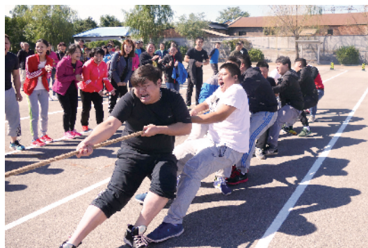
花乡白盆窑村工会举办首届职工秋季趣味运动会