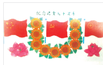
傅成祥为纪念建党七十周年而画的作品