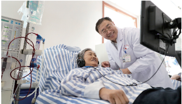
“大妈您别着急，我给您换一个电视节目”。