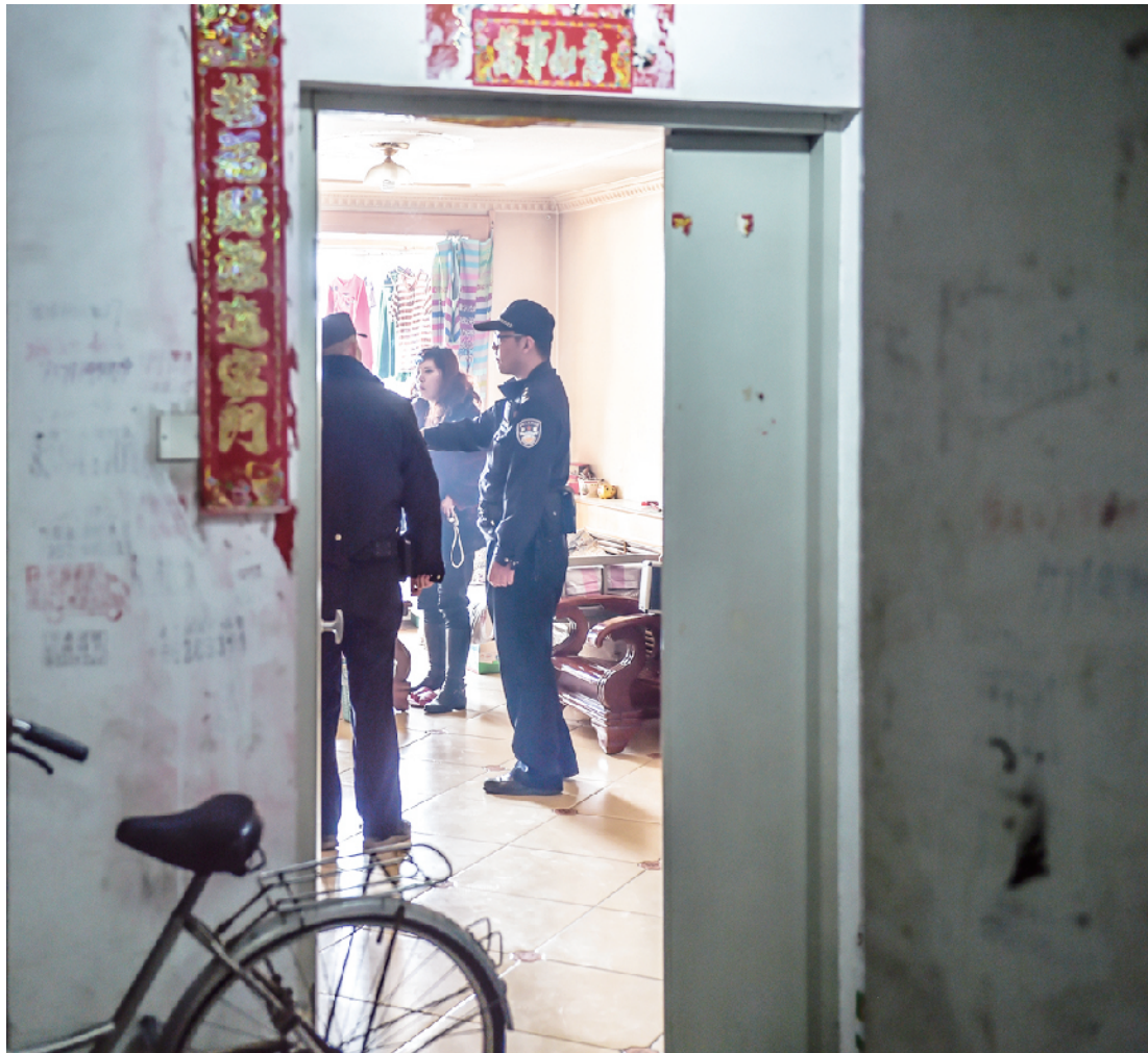
接到报警电话后来到辖区居民家进行调解。