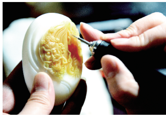
即将完成的玉雕作品。